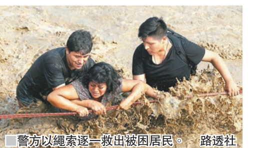
警方以繩索逐一救出被困居民。路透社

政府昨日發佈緊急法令，提高本年度財政預算3%，即44億新索爾(約105億港元)，作為緊急救援及重建資金。財長索恩表示，緊急增加預算不會影響政府將赤字減至佔國內生產總值(GDP)2.5%的目標，並相信極端天氣不會促使當局向下修訂經濟增長，暫維持今年兩年估計分別增長3.8%及4.3%。美聯社/路透社