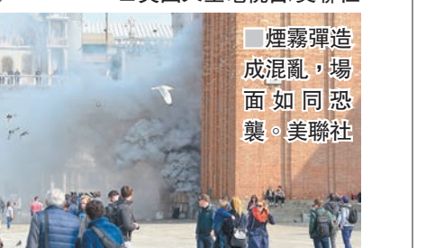
煙霧彈造成混亂，場面如同恐襲。