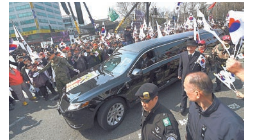
朴槿惠支持者上街抗議，並送別早前喪生的示威者靈柩。