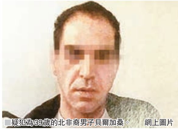
疑犯為39歲的北非裔男子貝爾加桑。