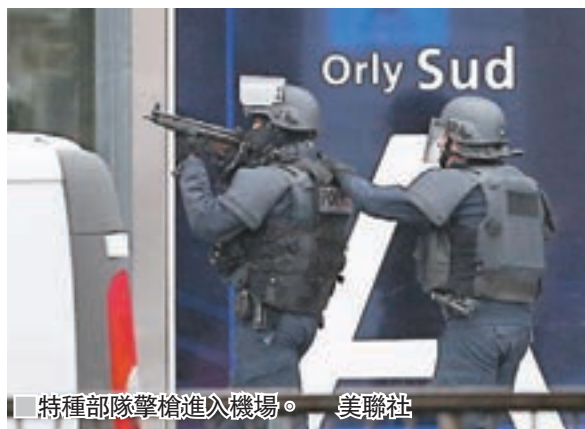
特種部隊擊槍進入機場。

法國巴黎昨日早上發生連環槍擊案，一名男子在北部市郊被警員截查時，開槍擊傷一名女警，先後偷走兩輛汽車逃往南部的奧利機場。當局表示，疑犯在機場企圖搶走一名特種部隊女兵配備的步槍，遭一同巡邏的士兵擊斃。警方在他身上未有搜獲爆炸品，正調查其犯案動機，巴黎檢方反恐部門正接手調查。據報疑犯是被情報及司法部門列入監察名單的激進伊斯蘭分子。