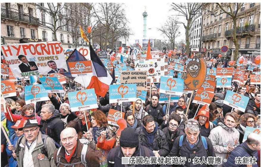
法國左翼發起遊行，多人響應。

民調顯示投票率低 有利勒龐 巴黎政治學院政治研究中心近日的調查顯示，只有65%選民表明必然會投票，踴躍程度遠低於2012年上屆總統選舉，投票意欲明顯偏低。研究員科特雷認為，由於極右支持者投票意向相對堅定，整體投票率低有助勒龐