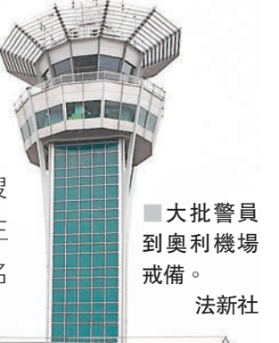
大批警員到奧利機場戒備。

法國巴黎昨日早上發生連環槍擊案，一名男子在北部市郊被警員截查時，開槍擊傷一名女警，先後偷走兩輛汽車逃往南部的奧利機場。當局表示，疑犯在機場企圖搶走一名特種部隊女兵配備的步槍，遭一同巡邏的士兵擊斃。警方在他身上未有搜獲爆炸品，正調查其犯案動機，巴黎檢方反恐部門正接手調查。據報疑犯是被情報及司法部門列入監察名單的激進伊斯蘭分子。