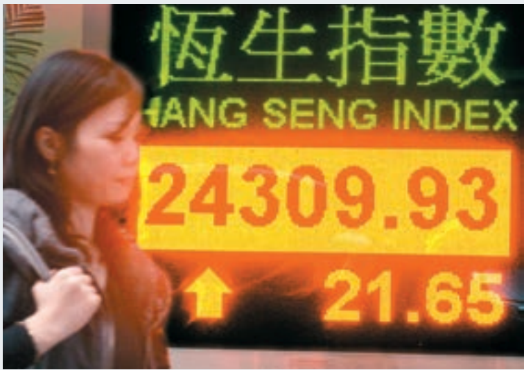
▲ 港股昨再創逾1年半收市新高，大市成交逾千二億元。

香港文匯報訊 (記者 周紹基) 美國宣佈加息後，港股前日大升500點後昨全日好淡爭持，但在重磅股騰訊(0700)股價再破頂奮力支持下，仍升21點報24,309點，創逾1年半收市高位。資金有流入跡象，昨日大市成交高達1,212.57億元，是2015年8月底以來最高。分析員認為，近月「滬深港基金」在內地熱銷，集資規模大增下，他們有需要加快配置港市場，讓港股有望進一步升上今年高位。