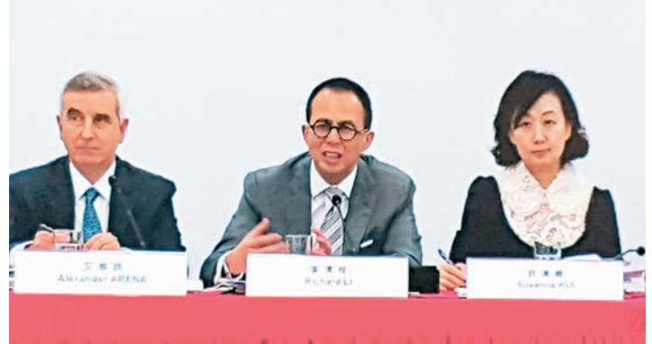
▲ 李澤楷(中)稱，對有線電視可能不再經營感到「驚奇」。歐陽偉昉 攝

香港文匯報訊 (記者 歐陽偉昉) 有線電視的母公司有線寬頻(1097)不再獲大股東九倉(0004)注資，電訊盈科(0008)主席「小小超」李澤楷昨在周年股東會上，對有線電視可能不再經營感到「驚奇」。他指電盈已投資3.5億元發展ViuTV，預期在3年至4年內不會有盈利，不過旗下收費電視Now TV每年有5,000萬至8,000萬元現金流可幫助發展免費電視，而且兩者可發揮協同效應，成本比競爭者低，長遠而言對公司股值和淨值會有正面影響。他又指現時沒有計劃分拆ViuTV。