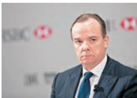
▲ 歐智華被法官駁回要求終止英國稅務機關對他的稅務調查。資料圖片

英國稅務機關在2015年底開始調查歐智華，懷疑他在香港工作期間，曾經將部分收入存放在在巴拿馬成立的離岸公司。歐智華其後在英國國會被質詢時，否認使用巴拿馬註冊公司在匯豐瑞士分行開設賬戶是為了逃稅，並稱自己每年以最高稅率向英國政府交稅。匯控昨收報64.15元，跌0.31%。