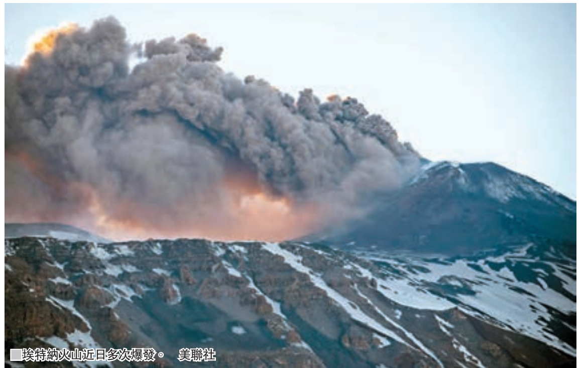
埃特納火山近日多次爆發。