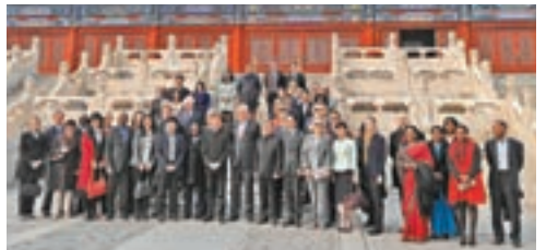
來自「一帶一路」沿線30多國的駐華使節、近60位高級外交官共享中華傳統文化之美。