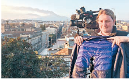
攝製隊邊走邊拍攝。網上圖片