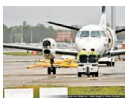
客機編號 REX 768，機師向控制塔求救，表示一邊螺旋槳脫落，但仍然可以飛行。有航空專家表示，不清楚為何客機在螺旋槳脫落後仍可以飛行，形容差點便釀成空難。

澳洲區域快線航空公司(Rex)一架由新南威爾士省飛往悉尼的紳寶340型客機，昨日飛至距悉尼機場約19公里時，機身右邊螺旋槳突然脫落，幸好機師臨危不亂，進行緊急降落，16名乘客及3名機組人員安全。澳洲交通安全局(ATSB)相信，脫落的組件可能墜落悉尼市郊，呼籲公眾把零件交還當局協助調查。