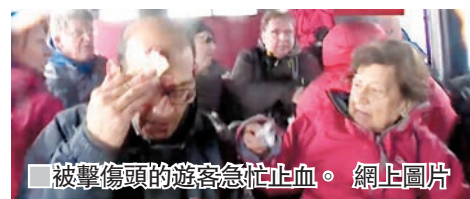
被擊傷頭的遊客急忙止血。

攝製隊、15名遊客、科學家和導遊，10人被降下的高溫岩石輕微灼傷或割傷，其中6人頭或手受傷送院，但傷勢並不嚴重。