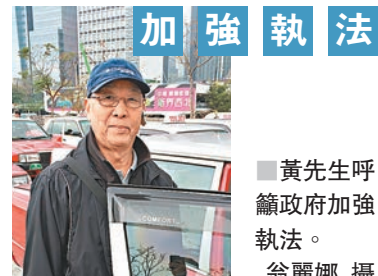
黃先生呼籲政府加強執法。