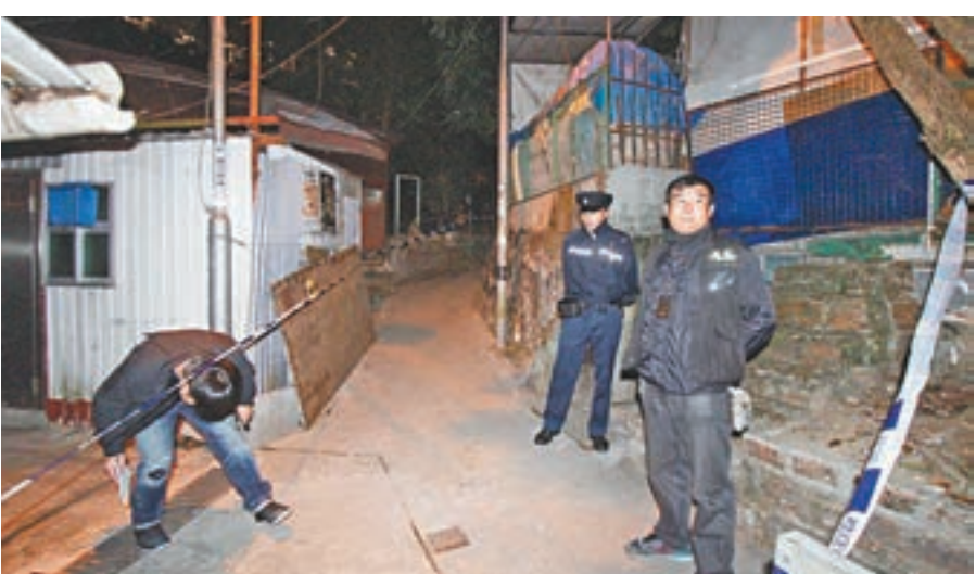
大批警員封鎖禾寮坑村兇案現場調查。

法,驅趕其他經營者,壟斷沙田、青衣、東涌等地方的地盤飯盒生意。他們會先找價錢較低的食肆飯盒,用客貨車運到地盤賣給工人,一個飯盒約35元,成本約20元,每個飯盒可賺取15元,根據地盤人數計算,每月收入可達180萬元,利潤高達80萬元。新界南反黑組接手跟進後,在去年3月展開「尖鉗」及「拓荒者」臥底行動,分階段派出多名臥底探員,滲入黑社會組織搜證,其間發現沙田區的黑幫涉及毒品、詐騙、聚眾毆鬥及其他黑社會相關罪行。