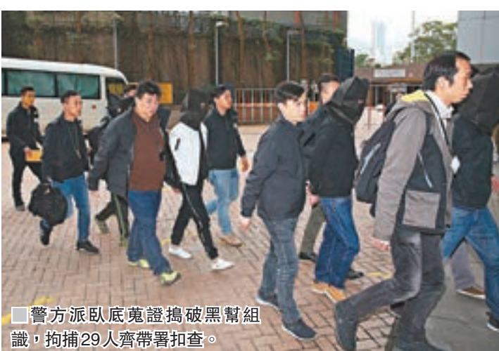
警方派臥底蒐證搗破黑幫組織,拘捕29人齊帶署扣查。

香港文匯報訊(記者 杜法祖)一個活躍沙田區的黑社會組織,壟斷沙田、青衣、東涌等地方的地盤飯盒生意,每月收入達180萬元,警方去年派出多名臥底探員滲入該黑幫搜證後,前日展開行動,拘捕包括黑幫頭目及骨幹成員等共29人,檢獲多把利刀及鐵通,相信已成功瓦解該個犯罪集團。