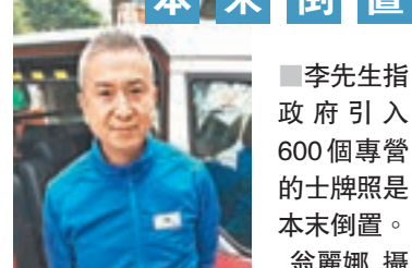
李先生指政府引入600個專營的士牌照是本末倒置。