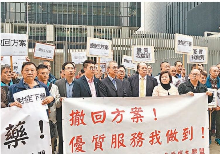
的士業界昨晨在政總外集會,向多位立法會議員遞交請願信。