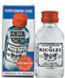
同款的法國雙飛人藥水。

香港文匯報訊(記者 杜法祖)一名63歲內地女遊客前年底光顧旺角一間藥房,購買兩支共值60元的雙飛人藥水,「碌卡」後竟發現單據銀碼是5萬元。藥房兩名店員事後遭檢控,經審訊後昨日在九龍城裁判法院同被裁定欺詐罪成,裁判官坦言:「唔想畀任何虛假希望你哋。」判囚是唯一選擇,着令將兩人還押至下月5日,待索取背景和青少年罪犯評估報告後始正式判刑。