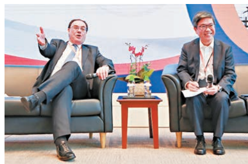
■ 英國金融市場行為監管局總裁 Andrew Bailey(左)與金管局副總裁阮國恒討論在香港建立良好銀行業文化的方法。

香港文匯報訊 金管局昨在港主辦首屆以「樹立良好的香港銀行業文化」為題的獨立非執行董事研討會。是項研討會由金管局為裝備獨立非執行董事(獨立非執董)及提升其專業能力，使其在香港銀行董事局中更有效地履行職責而推出的另一新舉。 活動共有逾百位來自34間本地註冊銀行的獨立非執董參加，彼此間進行具建設性的交流，並與金管局探討共同關注事項，當中包括金管局日益重視的銀行業文化及企業管治。 陳德霖倡穩善金融三足鼎 金管局總裁陳德霖在致閉幕辭時表示，穩善金融之道在於穩健圖利，亦要秉持負責任及公平待客的原則，才可長期持續的經營。陳德霖提出穩善金融的三足鼎，即嚴謹的監管和制度、良好的企業文化及恰當的獎勵制度。 於主題演講中，英國金融市場行為監管局總裁Andrew Bailey闡述英國如何為確立企業文化，以至企業管治與薪酬安排等相關範疇得到更大重視而進行變革。要建立良好的企業文化，企業本身以至監管機構充分明白其誘因非常重要。若能做到這點，成效將更佳。他強調董事局是這方面工作的關鍵。