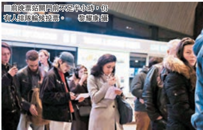
前晚票站開門前不足半小時，仍有人排隊等候投票。

雖然選情受到極右自由黨(PVV)的威脅，但荷蘭首相呂特仍然成功帶領自由民主人民黨(VVD)勝出大選，反映他主張的安全和穩定獲得選民肯定。呂特生於中產家庭，私下作風低調隨和，僅以二手車代步，每周四更會到海牙的貧民區兼職高中教師。與他相處20年的朋友形容，呂特是擁有美國夢的荷蘭人。 50歲的呂特年少時曾希望成為鋼琴家，不過於萊登大學接觸VVD的自由派政治立場後，從此加入政壇。他在2006至2007年的VVD黨內權鬥中展現堅毅意志，擊退主要對手，更於2010年成為荷蘭自1918年來首名自由派首相。分析認為，呂特近日在與土耳其的外交風波中採取強硬立場，增加選民對他帶領荷蘭的信心。 呂特雖然是荷蘭政壇建制一員，但他絕不離地，其手機是舊款型號，現時自住物業早於1992年購入，務實作風為人稱頌，亦贏得與英國前首相卡梅倫的友誼。