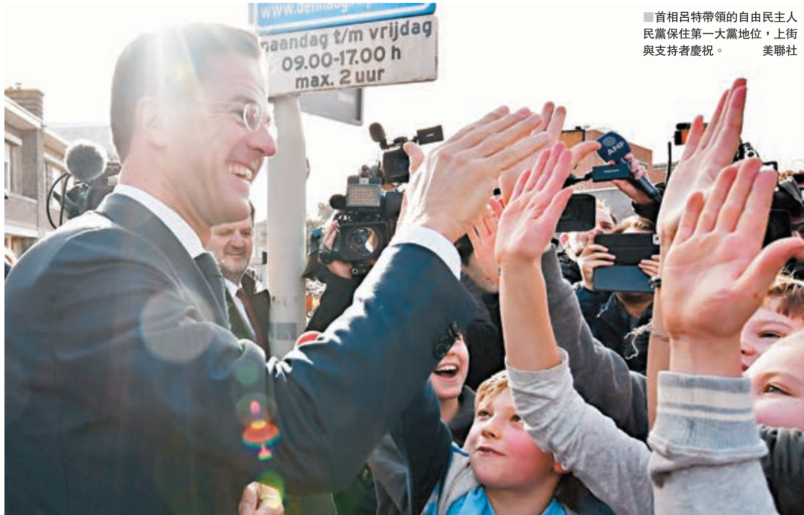
首相呂特帶領的自由民主人民黨保住第一大黨地位，上街與支持者慶祝。