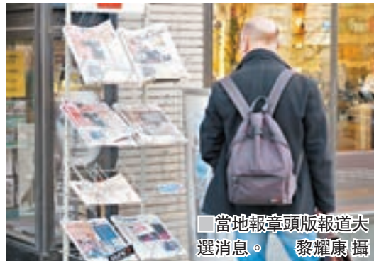
當地報章頭版報道大選消息。

出難民分配制度，加劇成員國間的分裂。在這兩項爭議中，左翼政黨往往出於理念，提倡接納及鼓勵移民，並繼續推動一體化，予人「不吃人間煙火」的印象，失去中間選民支持。 受債務問題困擾的歐盟提出嚴守財政紀律，下令成員國削減，一度令反對緊縮、支持福利政策的左翼受惠。然而左翼上台後過於內政和外交壓力，繼續推行緊縮政策，令選民失望。荷蘭以至歐洲中間偏左政黨的前路，恐怕會在右派及激進左派夾擊下，益發舉步維艱。