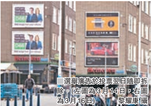
選舉廣告於投票翌日隨即拆除。(左圖為3月14日，右圖為3月16日)