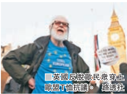
英國反脫歐民眾穿上歐盟T恤抗議。

條約》簽署60周年，文翠珊屆時將不會參與。據報她為免影響紀念活動，將不會在當天前啟動脫歐。 文翠珊早前表示，已準備好在未能達成任何協議下脫歐，強調「沒有協議比差勁的協議好」，外界擔心可能會為英國帶來嚴重衝擊。不過脫歐事務大臣戴德偉表示，情況未必如某些人想像中那麼可怕。 英國廣播公司《衛報》