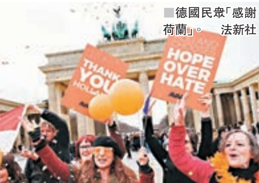
德國民眾「感謝荷蘭」。