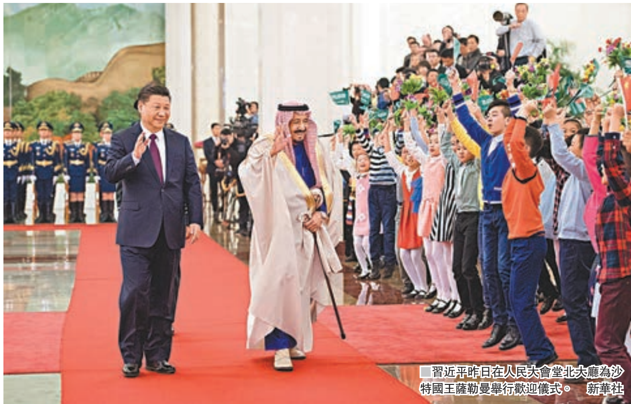
習近平昨日在人民大會堂北夾道為沙特國王薩勒曼舉行歡迎儀式。

薩勒曼表示，我對沙中關係高水平發展深感滿意。習近平主席去年對沙特的國事訪問十分成功，對推動兩國全面友好合作發揮了重要作用。沙方堅定奉行一個中國政策，願通過沙中高級別聯合委員會這一平台，進一步深化兩國在經貿、投資、金融、能源領域合作，提升兩國全面戰略夥伴關係。當今世界面臨恐怖主義威脅等諸多挑戰，國際社會應當形成合力攜手應對。沙特高度讚賞中國在國際事務中堅持不干涉內政、通過對話和平解決衝突的立場，讚賞中國在維護國際和平與安全方面的重要作用。沙方希望中方在中東事務中發揮更大作用，願同中方共同努力，促進世界和地區的和平、安全與繁榮。