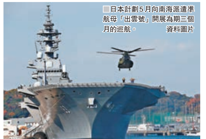
日本計劃5月向南海派遣軍艦「出雲號」開展為期三個月巡邏。資料圖片

在14日舉行的例行記者會上，華春瑩曾指出，如果「出雲號」只是正常的訪問幾個國家，正常的途經南海，那麼中方沒有任何意見，但如果去南海是另有企圖就另當別論了。中方希望日方能為這個地區的和平穩定真正多發揮一些負責任的作用。