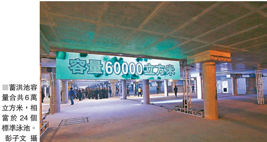
蓄洪池容量共6萬立方米，相當於24個標準泳池。

香港文匯報訊（記者 翁麗娜）工程歷時4年半的跑馬地地下蓄洪池，趕及今年雨季前全面啟用。財政司司長陳茂波昨日出席蓄洪池啟用典禮致辭時表示，工程提早一年完工，節省逾6,000萬元，佔工程成本5%。渠務署署長唐嘉鴻表示，蓄洪池容量共6萬立方米，相當於24個標準泳池，有助跑馬地及灣仔一帶抵禦「50年一遇」的大雨。渠務署正在重鋪二期工程地面的足球場，讓市民盡早享用。