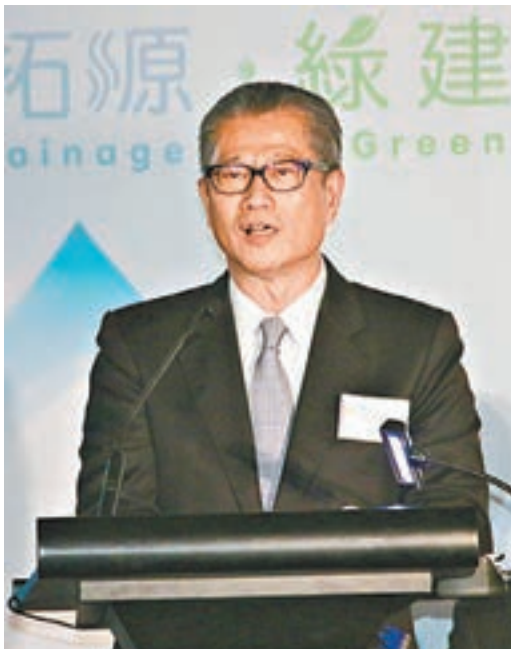
陳茂波呼籲立法會議員盡速審議，不要拉布。

他呼籲財委會主席陳健波大刀闊斧「剪布」，如反對派屢勸不改，不排除會發起全港地盤罷工示威。