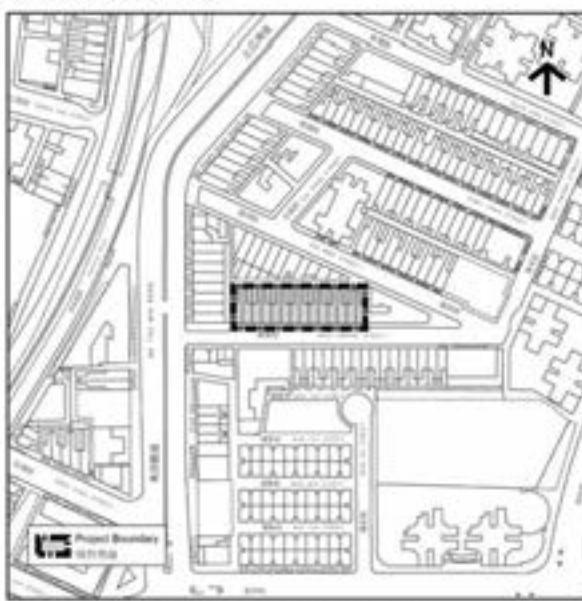
市區重建局榮光街發展項目

根據條例第28條，對該項目提出反對的人如因局長根據條例第24(4)(a)條作出的決定而感到受屈，可於該決定公布後30天內(即在2017年4月10日或之前)，向上訴委員會秘書提交上訴通知書(副本須送交局長)提出上訴。