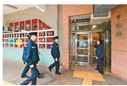
■警員到亨隆樓兇殺案現場調查。 ■涉擊斃同居女友的男疑人雙手上紙袋，腰纏鐵鏈，由探員押送醫院。