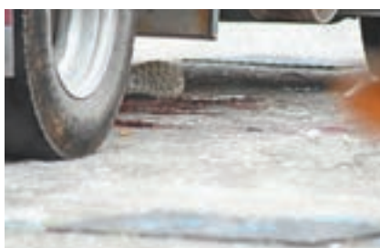
■貨車底遺下死者一灘血漬及鞋。

香港文匯報訊（記者 杜法祖）上水發生奪命車禍，一輛運載石油氣的輕型貨車，昨晨在河上鄉路倒車泊位後，司機與南亞裔跟車工人下車落貨時，赫見一名老翁昏迷倒在車底兩個車輪之間，消防員接報馳至將老翁救出，惜送院搶救後不治，跟車工人稱意外時「聽唔到，也感覺不到撞到人」。