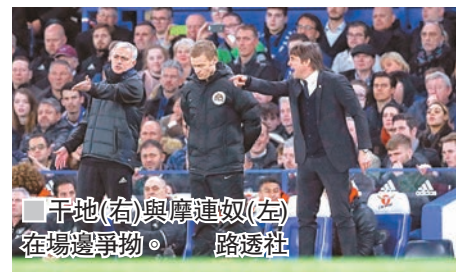
干地(右)與摩連奴(左)在場邊爭拗。