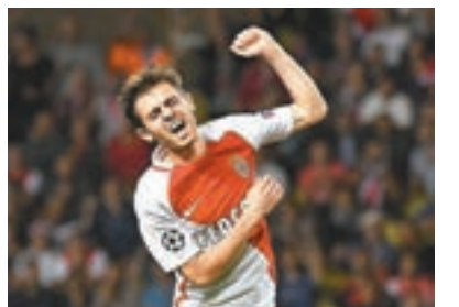
摩納哥中場貝拿度施華。