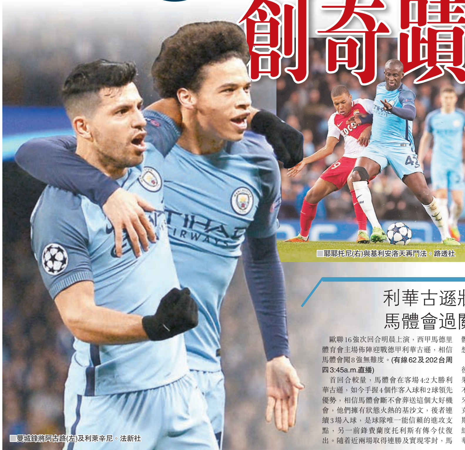
耶耶托尼(右)與基利安洛天再鬥法。