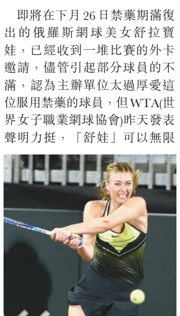
俄羅斯網球美女舒拉寶娃。

即將在下月26日禁藥期滿復出的俄羅斯網球美女舒拉寶娃，已經收到一堆比賽的外卡邀請，儘管引起部分球員的不滿，認為主辦單位太過厚愛這位服用禁藥的球員，但WTA(世界女子職業網球協會)昨天發表聲明力挺，「舒娃」可以無限申請網賽外卡。