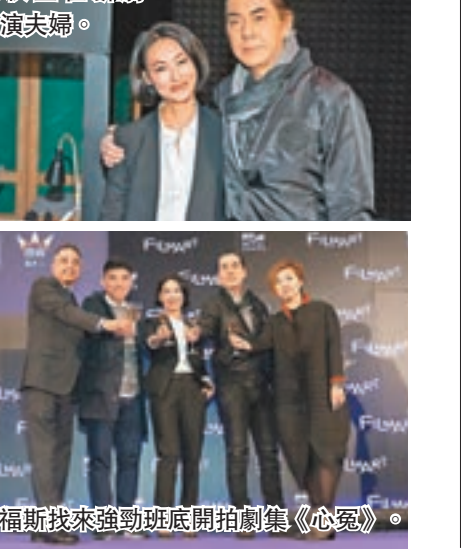
福斯找來強勁班底開拍劇集《心冤》。

裝,她自己也想參演,待遇方面則要求連同梳頭化妝12小時。「我年紀大,體力捱到,個樣未必捱到。」有指該劇或會對無綫的台慶劇,小紅姐自言不清楚公司的行政安排,身為演員最重要是劇本好。 劇中秋生和小紅姐是扮演兩夫妻,前者亦牽涉到一宗殺警案,一開場便失蹤,他稱不知如何演繹這隱形角色,會有挑戰性。說到酬勞,秋生謂:「一般,當然低過內地,但比無綫高一點。(待遇和工時呢?)我們標準一樣的,工時是為工作,不是要偷懶或打麻雀,都是一日一小時開工,一半時間沖涼、睡覺。(有演員拍到沒法睡覺?)沒有睡那便有黑眼圈,又爆紅筋,對白講不好,也不知自己做什麼,好像在遊魂。」