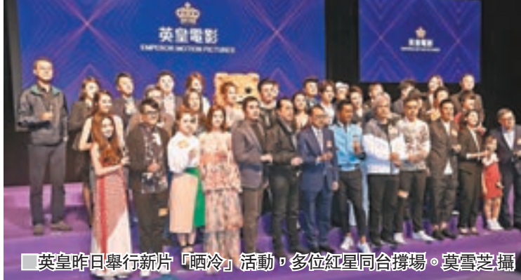
英皇昨日舉行新片「晒冷」活動,多位紅星同合撐場。