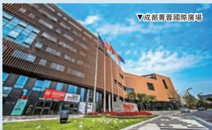
▼成都菁蓉國際廣場

隨着經濟全球化快速推進，成都高新區創新實施「柔性引才」方式，加大海外高層次人才的引進力度。2016年，該區通過「柔性引進」方式，先後引進4位諾貝爾獎得主、5位院士及世界500強高管人