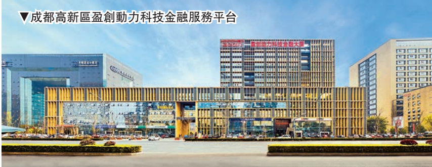
▼成都高新區盈創動力科技金融服務平台