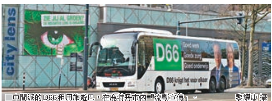
中間派的D66租用旅遊巴士，在鹿特丹市內「流動宣傳」。

不過更受國際社會關注的，是政治兩極化和疑歐情緒擴散至歐盟其他成員國。在荷蘭，要求脫離歐盟的呼聲不如英國般強烈，但仍有相當一部分選民支持「荷退」(Nexit)，懷爾德斯倚仗歐派的支持而崛起，歐盟其他極右政客也會試圖把握這機會，鼓吹各自的脫歐立場，包括法國「國民陣營」領袖勒龐。由此可見，就算懷爾德斯未能勝選，他帶來的政治震盪未來在荷蘭和歐洲政壇仍會引起迴響。