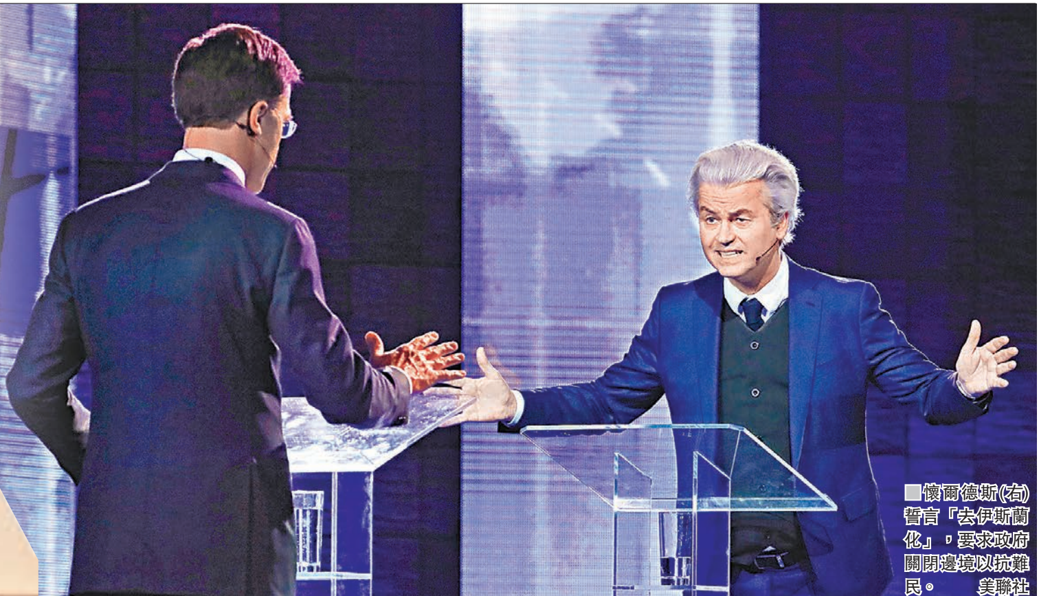
懷爾德斯(右)誓言「去伊斯蘭化」，要求政府關閉邊境以抗難民。