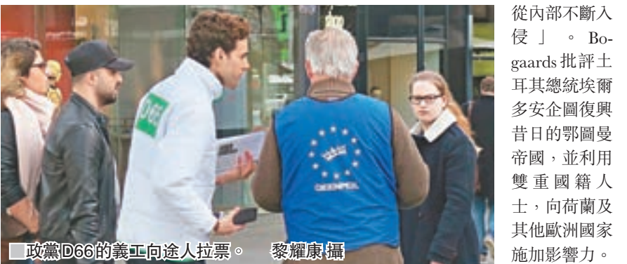
政黨D66的義工向途人拉票。

荷蘭「思考黨」(DENK)兩名國會議員都是土耳其裔，該黨大力提倡移民權益，更揚言移民不一定要融入社會，Bogaards認為DENK反映擁有土耳其及荷蘭雙重國籍的人可能無法接受荷蘭社會價值觀，甚至忠於土耳其政府，長此下去將成心腹大患，「他們就像癌細胞，從內部不斷入侵」。Bogaards批評土耳其總統埃爾多安企圖復興昔日的鄂圖曼帝國，並利用雙重國籍人士，向荷蘭及其他歐洲國家施加影響力。