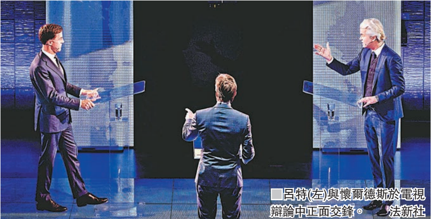
呂特(左)與懷爾德斯於電視辯論中正面交鋒。