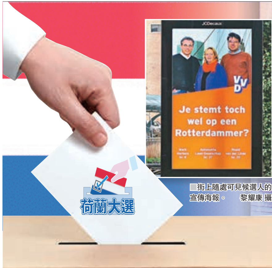
街上隨處可見候選人的宣傳海報。