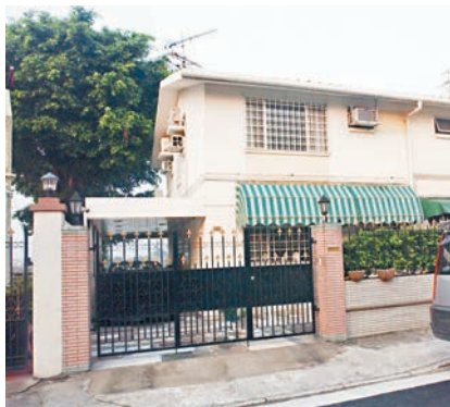
元明錦繡花園有單位零讓價沽出,呎價升穿1.5萬元。

香港文匯報訊(記者 蘇洪鑽)傳統洋房屋苑隨大市升值,元明錦繡花園出現雙破頂。中原龍智峰表示,屋苑最新錄河北第十二街單號屋成交,單位面積1,048方呎,連約2,600方呎獨立大花園,業主開價1,600萬元,日前零讓價沽出,折合呎價15,267元,造價創屋苑新高,而呎價則首度升穿1.5萬元水平。