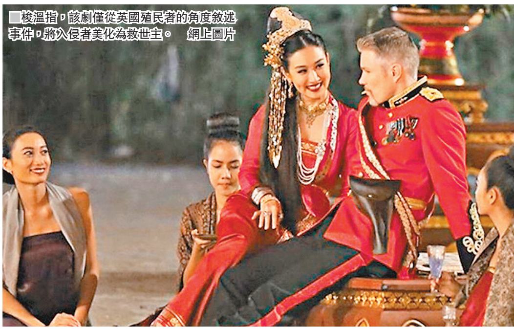
梭溫指，該劇僅從英國殖民者的角度敘述事件，將入侵者美化為救世主。網上圖片