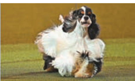
邁阿密成為全場總冠軍。