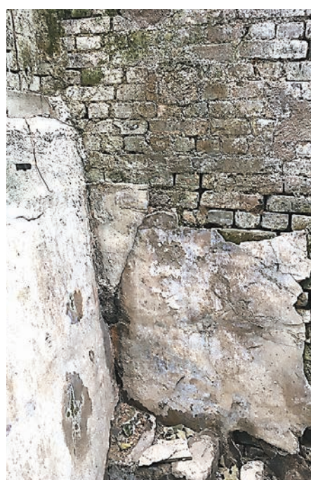
■新方案建議將閣麟街的中間地段改建為行人通道。現場可見,下部分牆身被塗上混凝土。