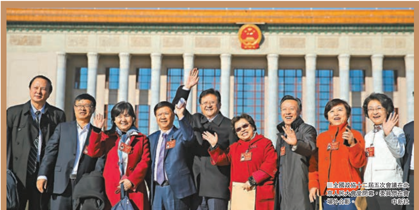
全國政協十二屆五次會議在北京人民大會堂閉幕,委員們在會場外合影。