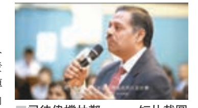
司徒偉讚揚林鄭。短片截圖

他並期望,下一任特首可以讓本地年輕人有機會在香港繼續發展,又讚賞林鄭月娥在政府任職30多年的經驗及樂於聆聽的態度,「相信她能勝任。」