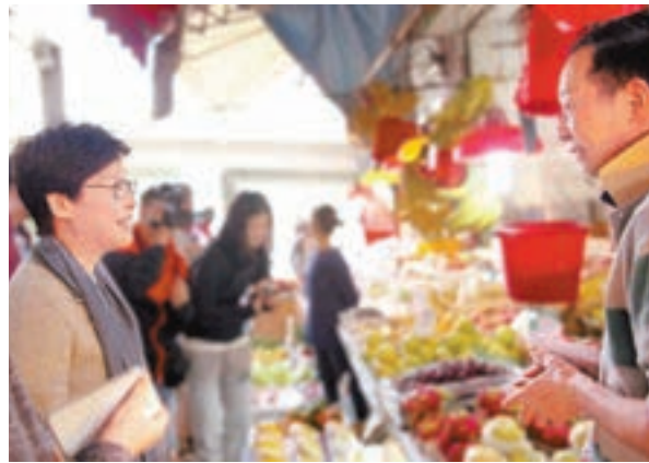
林鄭月娥較早前探訪南區,聽取小商戶的意見。資料圖片

香港文匯報訊(記者 朱明文)特首候選人林鄭月娥日前與多名港島各區區議會選委會面,與會者關注多項民生議題,包括林鄭在任政務司司長時提出的「三座大山」其中兩座——領展及港鐵。有與會者表示,林鄭對各項民生議題反應正面,並同意為地區新增人口前要先做好交通,有人更表明會投票給她。