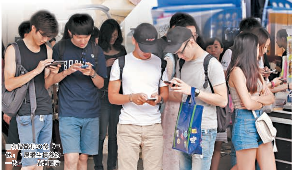
有指香港90後「三低」，屬嬌生慣養的一代。資料圖片

90後仍在讀中學時，較少接觸現實社會，通常被人覺得是嬌生慣養的一代，乃至把他們標籤為自理能力、情緒智商和逆力三低的「港孩」。隨着90後逐漸長大成人，不但進入職場，而且在不少社會政治運動中能看見他們的蹤影，有人認為90後比80後更激進之餘，亦較自我中心，做事衝動，缺乏周詳的考慮，也忽略身邊人的感受。此說當否，眾說紛紛。