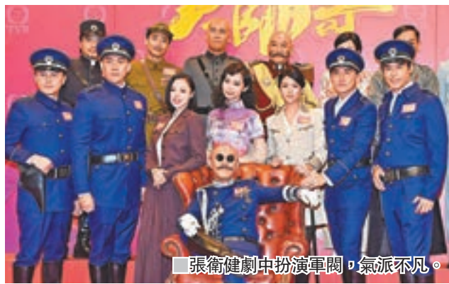
張衛健劇中扮演軍閥，氣派不凡。

香港文匯報訊(記者李思穎)張衛健(Dicky)相隔20年重返無綫拍攝50周年台慶劇《大帥哥》，昨日聯同參與演員蔡思貝、洪永城、楊秀惠、曹永廉、徐榮、譚凱琪等在將軍澳電視城試造型。戲中扮演軍閥的Dicky以光頭Look加二撇雞的軍裝現身，與1972年許冠文演的電影《大軍閥》造型十分相近，同樣氣派不凡。