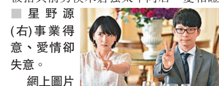
星野源(右)事業得意、愛情卻失意。

香港文匯報訊 日本男歌手星野源去年與新垣結衣主演的《逃跑雖可恥但有用》爆紅，男女主角攜手創事業高峰。不過，現年36歲的星野源事業得意、愛情卻失意，近日其緋聞女友二階堂富美被指與前男模米倉強太同居，變相證實