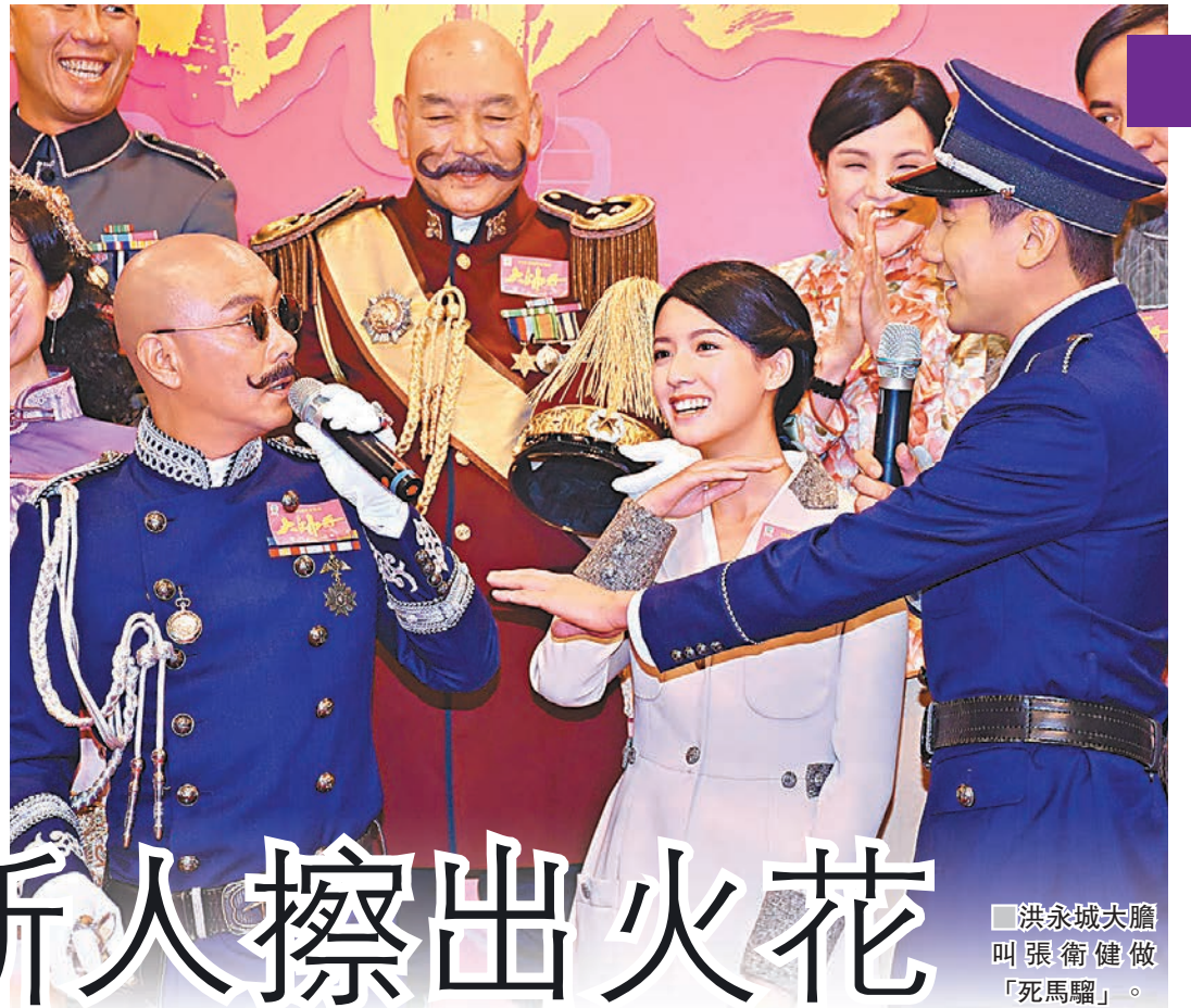
洪永城大膽叫張衛健做「死馬騮」。