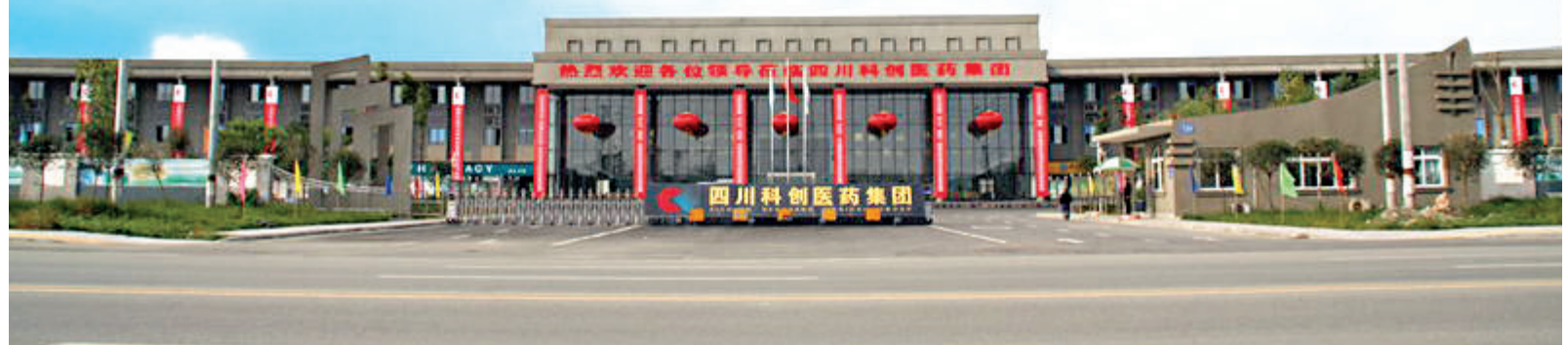
▼科創控股集團溫江醫藥產業園