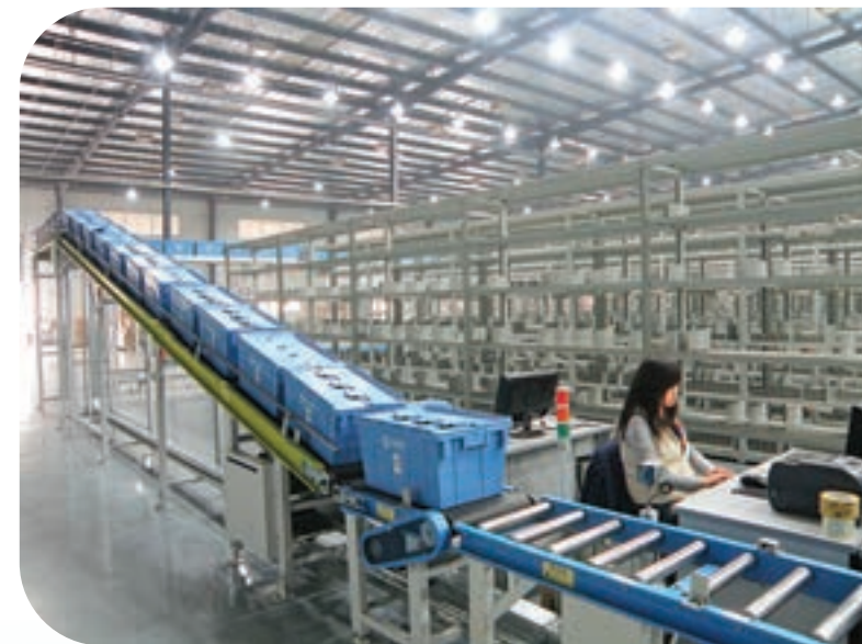
▲四川科創醫藥集團物流中心