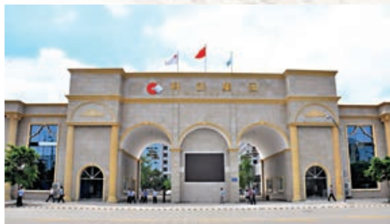
▲科創控股集團總部園區

團的產業結構、管理體制、運行機制、發展模式等都將在去年的基礎上進一步發生深刻的轉變。