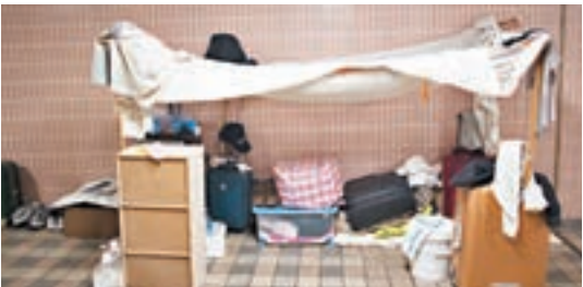
香港貧窮露宿者無家可歸。資料圖片

關愛基金：2011年推出，已批出36個援助項目，總承擔額約72億港元，逾141萬人次受惠，照顧不同的弱勢社群的需要。基金至今亦有11個項目被納入政府的恒常資助，每年經常開支約為7億港元。