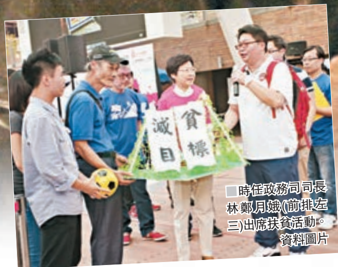
時任政務司司長林鄭月娥(前排左三)出席扶貧活動。