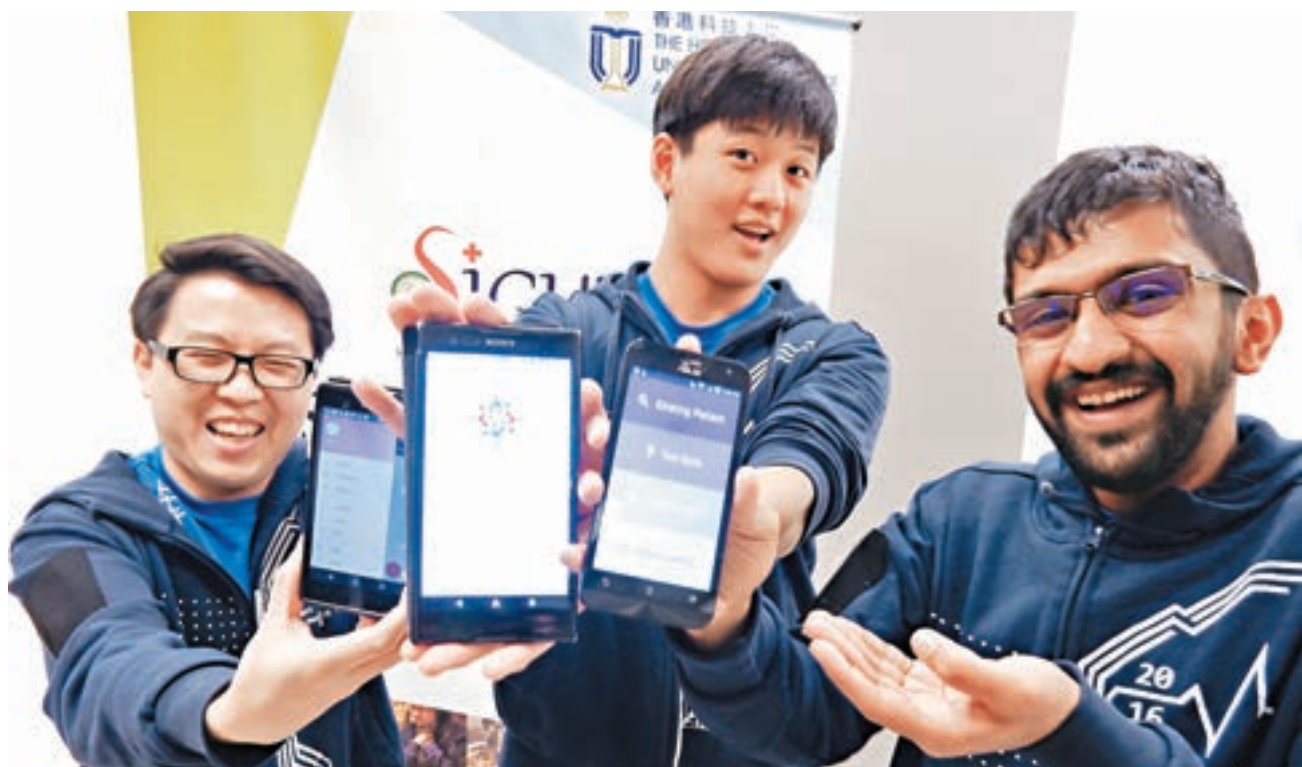
科大獲獎學生將前往印尼,向當地居民及醫療人員推廣使用電子醫療記錄手機系統。

手提設備比現時當地醫院採用的儀器更輕便,體積更細小,方便醫護人員使用,而價錢亦約為傳統儀器的十分之一。