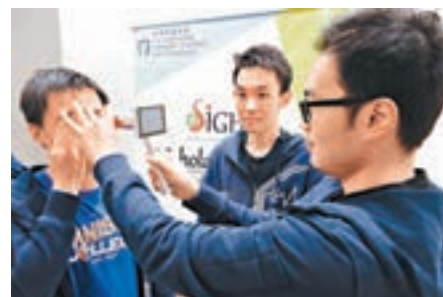
學生早前於印尼日惹收集醫療數據。