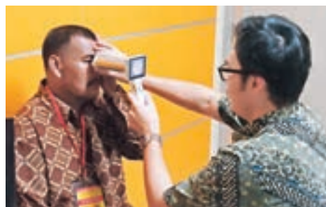
科大大學生於印尼一間診所內,測試使用手提式眼底相機檢測效果。