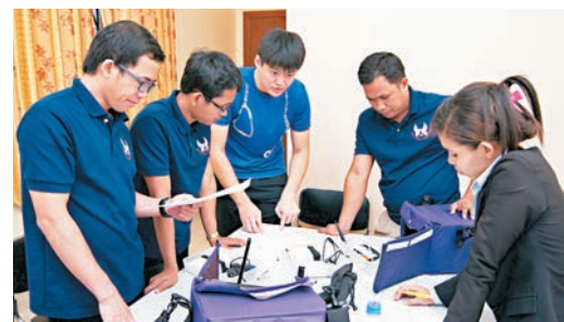
科大大學生向柬埔寨醫護人員示範如何使用電子醫療記錄系統手機程式。