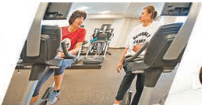
女排隊員楊方旭(右)赴洛杉磯看望郎平。