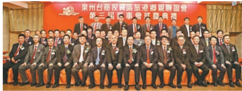
■泉州台商投資區旅港鄉親聯誼會舉行第三屆董事會就職典禮。