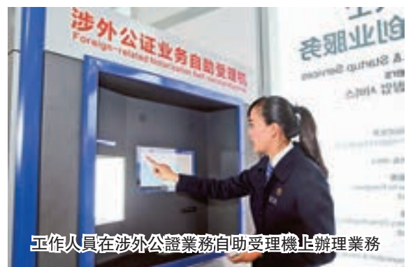
工作人員在涉外公證業務自助受理機上辦理業務