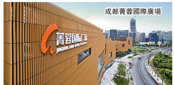
成都青蓉國際廣場

今年2月20日,成都高新區正式對外發布《成都高新區創新創業發展規劃(2016-2020)》(以下簡稱《雙創規劃》),該區將堅持「國際化、專業化、眾創化、集群化」定位和「大空間、大視野、大集群」發展理念,設立50億元(人民幣,下同)協同創新專項資金、50億元大企業創新專項資金、50億元領軍人才專項資金,在5年內累計投入150億元驅動雙創,吸引全球創新創業資源,着力打造萬億級國際創新創業中心。