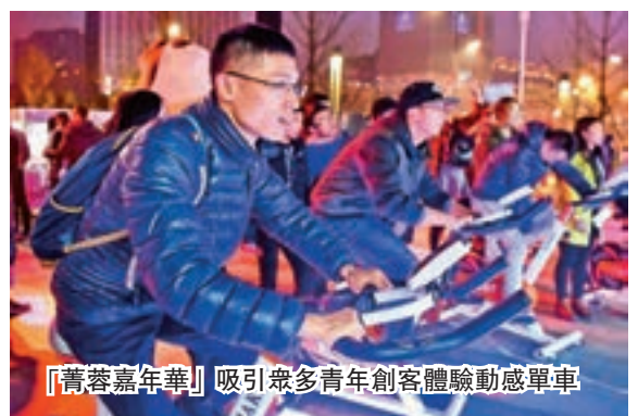
「蓉蓉嘉年華」吸引眾多青年創客體驗動感單車

在推進全域創新進程中,成都高新區將着力實施「示範基地帶動」「龍頭引領」「微巨人培育」「國際化牽引」「雙創精品活動」五大工程,以阿里、微軟等國際化巨頭以及中韓、中法產業園等國際化平台為依託,拓展創新創業的內涵,提升創新創業的水平。