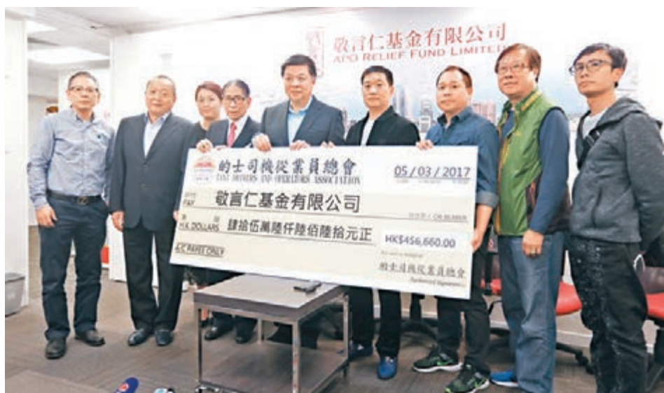
的士司機從業員總會向敬言仁基金提交支票。