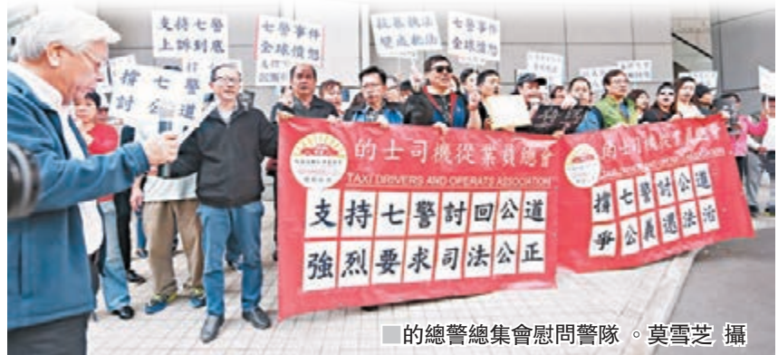
的總會總集會慰問警隊。

傷亡是世界罕見，然而最終有警員要入獄，失去事業、前途，家庭也承受大壓力。他認為今次法庭判刑過重，的總會義無反顧撐警察，為他們送上祝福，冀七名警員能獲撤銷控罪，重新歸隊。 鄭玉佳續指，七名警員犯的只是「技術性」錯誤，比喻作追捕賊人期間，對方反抗，警察因此不慎作過多暴力。他又指「凡事有大錯有小錯」，認為警員在拘捕曾健超時，所使用手段是正常及在所難免，只是可能不小心重手了。他稱對七警深表同情及理解，又質疑法庭對執行職務的人判刑過重。 鄭玉佳又質問，為什麼戴耀廷、陳健民及朱耀明至今仍然相安無事？他希望三人最後受到法律制裁，否則將影響警察士氣。他指今次維護治安的警察要入獄，讓人震驚，指警察是香港法治的靈魂，如果士氣得不到提振，恐怕影響香港治安。 有集會人士表示，法官重判七警察，令市民感到氣憤不平，認為法庭對待「佔中」暴徒和盡忠職守維護秩序的警察，量刑厚此薄彼，希望七警能上訴得直。