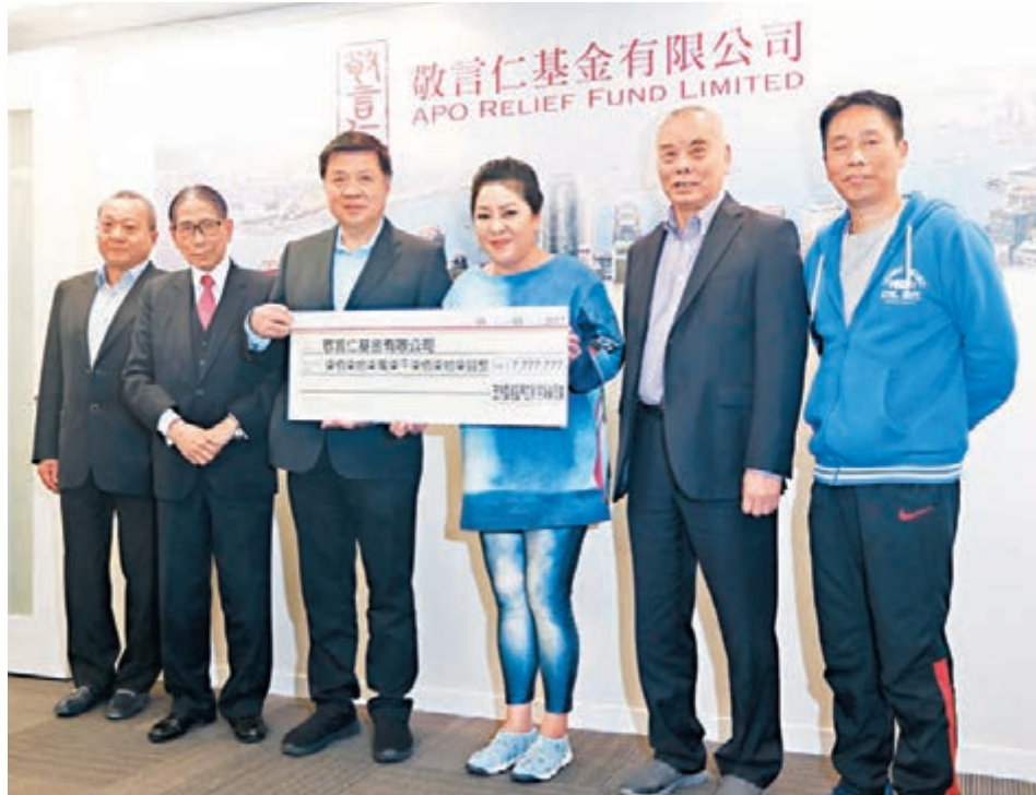
演藝界募集到777萬港元，並將支票轉予「敬言仁基金」。