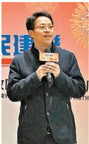
■張曉明出席民建聯宴會時澄清謠言。

香港文匯報訊（記者 鄭治祖）隨著特首選舉進入更緊張的候選人比拼階段，有人蓄意散播謠言影響市民對選舉信心，聲稱中央官員要選委拍下選票，更稱要將選票運去內地驗指紋云云。據引述，香港中聯辦主任張曉明昨晚出席民建聯晚宴時，直指坊間謠言太多，散播情況太囂張，不能不作出澄清，更批評有關謠傳是「離晒大譜」、「荒誕不經」，散播這些謠言者「用心險惡」。