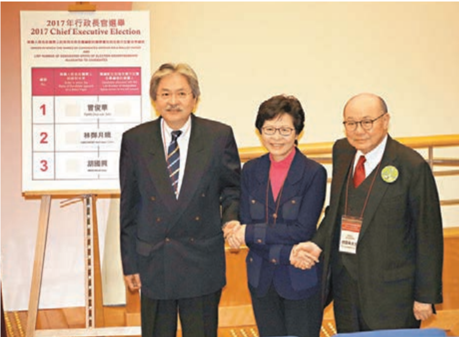
■三名特首候選人握手問好。

他承認，倘有選委不肯關手機，他們不能阻止其投票或將其選票作廢，但會有大量工作人員巡視及打醒精神特別留