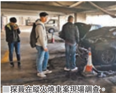
探員在縱火燒車案現場調查。

警方又翻看現場閉路電視片段，發現事前曾有兩名可疑男子走近莊的座駕，其後車輛即冒煙起火，警方相信兩人與縱火案有關，該兩名可疑男子年約25歲至35歲、中