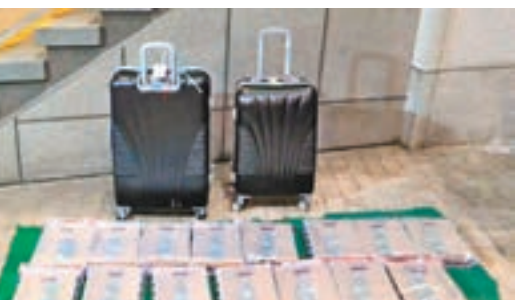
警方檢獲價值1,000萬元的液態可卡因。電視截圖