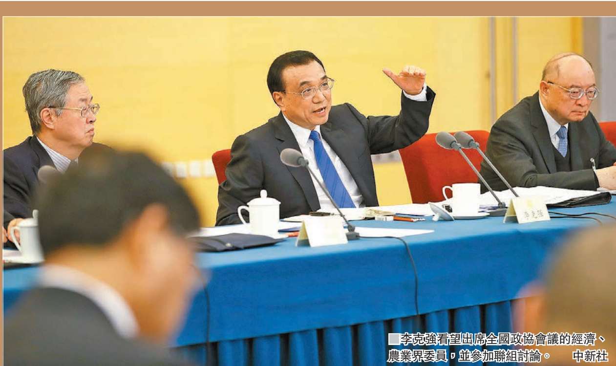
■李克強看望出席全國政協會議的經濟、農業界委員，並參加聯組討論。

當天有大批記者在場外等候李克強，李克強在進場和參加完聯組討論離開時，兩次在記者隊伍前駐足，並回答了幾個問題。有媒體提問：「總理，您對經濟有信心嗎？」李克強堅定回應道：「對中國經濟有信心，我們一定會戰勝困難。」