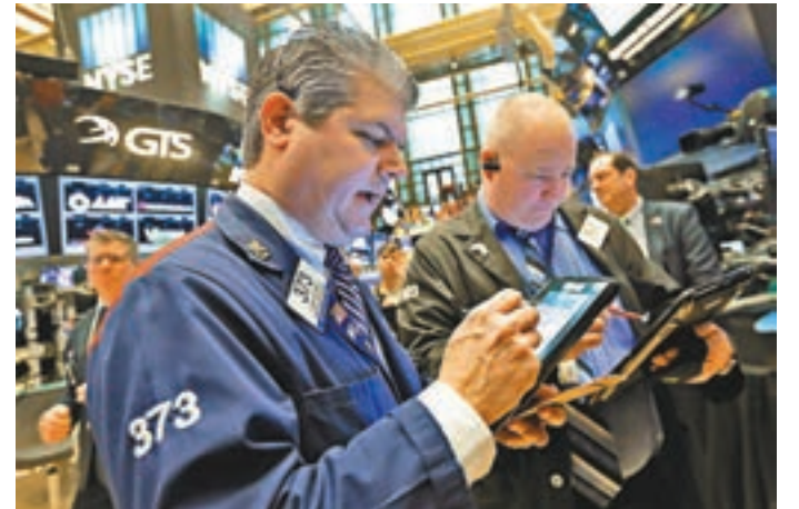
美國加息升溫,惟美高收益債仍享有息率優勢。資料圖片

為,美國今年加息的次數將有3次,值得一提的是,若中國加速向全球輸出通脹,美國加息次數更可能超過3次,美國寬鬆的貨幣環境將漸漸趨緊,以美國國債為首的各類債券價格都將受到衝擊。