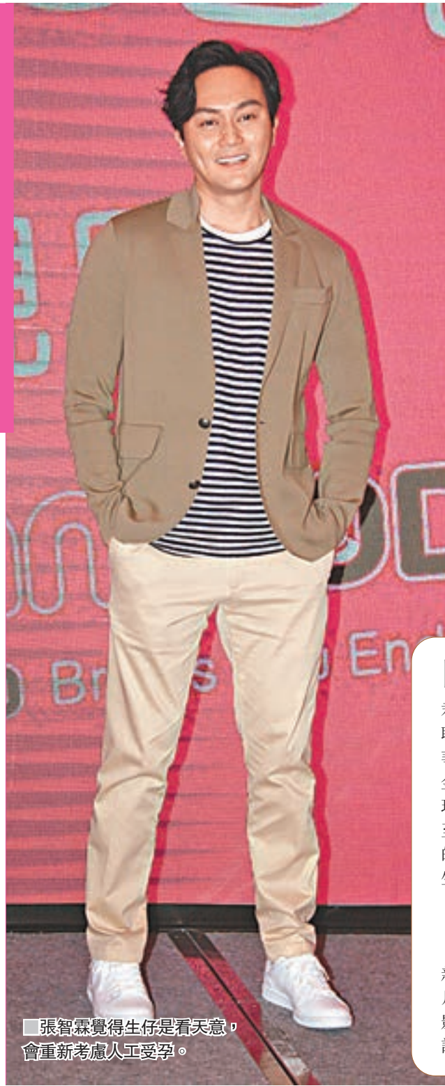
張智霖覺得生仔是看天意，會重新考慮人工受孕。

香港文匯報訊（記者 吳文釗）由hmv數碼中國娛樂集團成立的hmvod網上平台昨日正式開台，老闆蕭定一公佈平台會提供近1,500部正版歐美、港產、亞洲影視節目，目標提供超過5,000部影視娛樂讓用戶隨時隨地點播，甚至可以達到與戲院同步播放的效果。張智霖（Chilam）被問到何時才實行造人大計，他表示本月較清閒，會考慮一下。