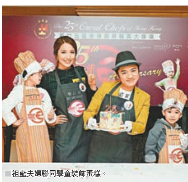
祖藍夫婦聯同學童裝飾蛋糕。