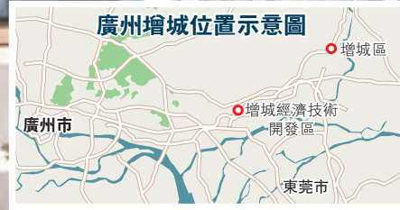
■廣州增城位置示意圖