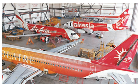
■廣州新科宇航作業區。本報廣州傳真