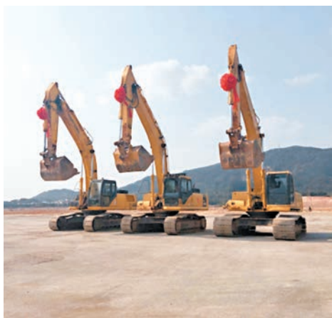
■富士康10.5代8K顯示器項目工地圍區施工現場。

居住、消費、研發以及人才服務等功能。專家認為,富士康項目地塊周邊已經有廣本、北汽、阿里巴巴等項目,去年又引進中汽中心、華電、東方雨虹等實體經濟項目,產業集聚程度大大提升。世界500強的富士康落地,必然形成新的產業集群,可以與周邊企業之間相互依託,產生更深、更廣的聯繫,將有利於廣州乃至廣東的產業升級,加快新舊動能轉換,帶動周邊地價房價抬升。