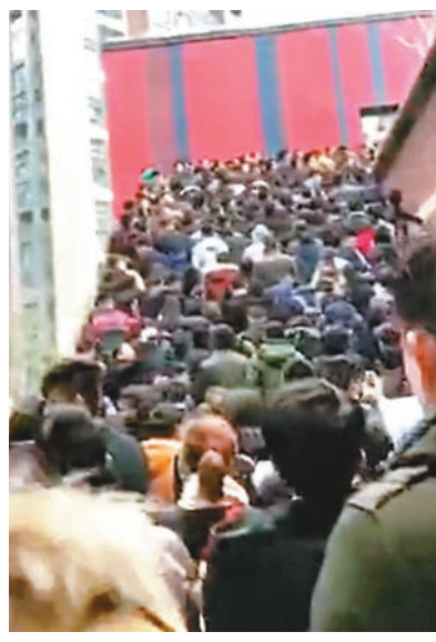
上海遠郊樓盤引來搶房場面。 網絡圖片

香港文匯報訊(記者 孔雲瓊 上海報道)尚處於淡季之中的上海樓市近期出現搶房現象。近日上海郊區嘉定樓盤「上海派」進行了二期項目加推,據售樓處工作人員表示,在正式開盤前2天,就有很多人趕來連夜排隊,此次推出的房源共797套,但最終購房者人數達1,500多人,認籌數是房源數量的翻倍,認購者最長需要排5小時才能入場進行搖號。售樓人員坦言,此種搶房現象在去年推盤時沒有發生過,反而在市場冷卻的今年發生。有參與認籌的準買家表示,此次新房地價定在3.3萬元(人民幣,下同),低於同個項目二手房的3.7萬元均價,所以被吸引過來購房。