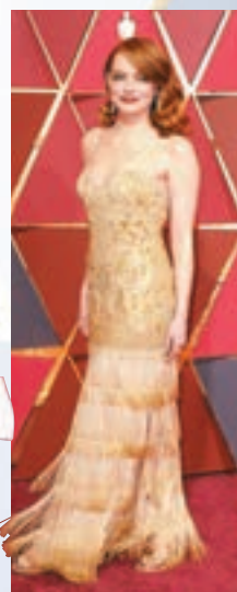
愛瑪史東 動感流蘇