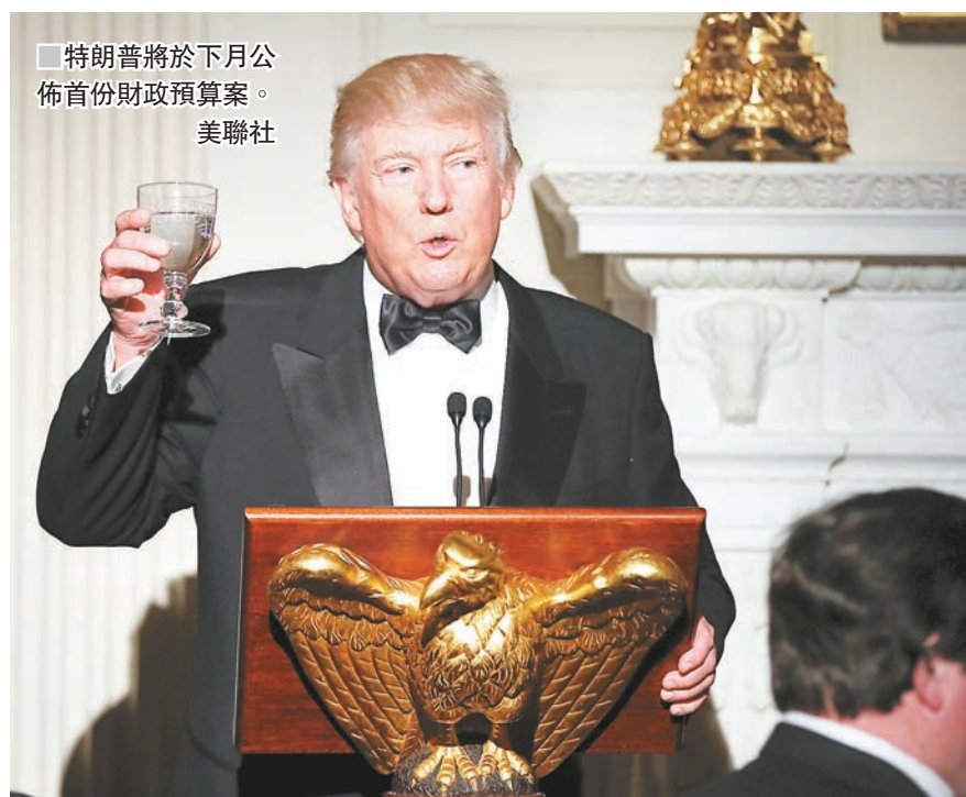
特朗普將於下月公佈首份財政預算案。