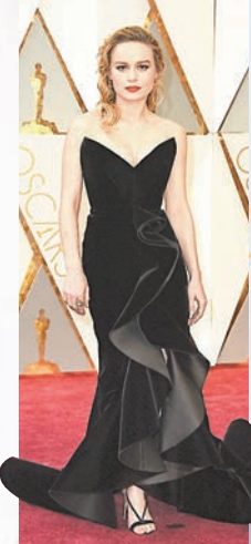
貝爾娜森 迷人波浪