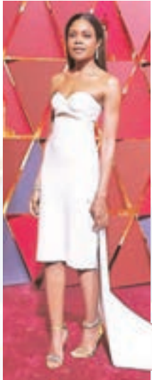
Naomie Harris 前衛性感