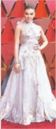
希莉辛菲 花花仙子