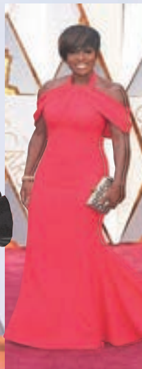
維奧拉戴維斯 露肩紅裙