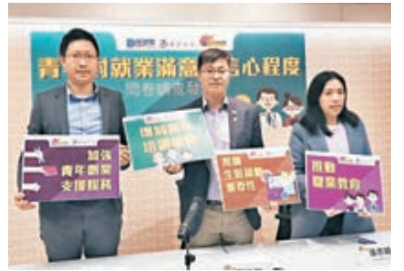
青年民建聯就青年及就業的滿意及信心作調查,四成受訪者對現職公司前景無信心,以及無信心未來一年薪金有升幅。

體,但已經無法補救。」研究團隊建議政府針對過去12個月有性生活者進行定期篩查,以便及早發現及轉介衣原體感染患者接受治療,並加強性教育。黃志威指出,現時針對衣原體感染的檢測迅速且準確,治療時只需服用一次性4粒藥物便可完全治癒。市民亦可自行前往衛生署公共衛生科診所做免費性病檢測。