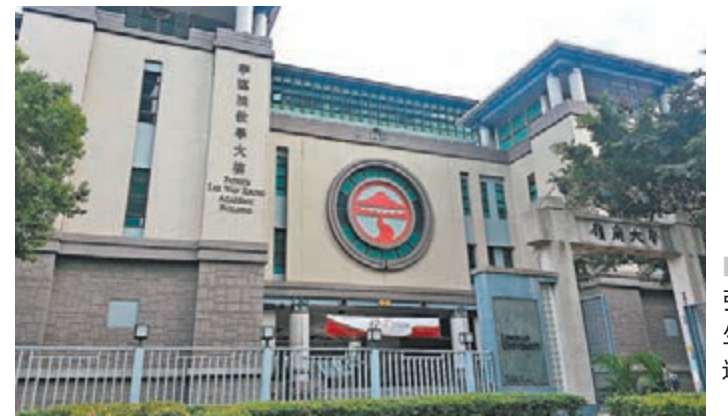
嶺大擬強制畢業生IELTS達6.5分。