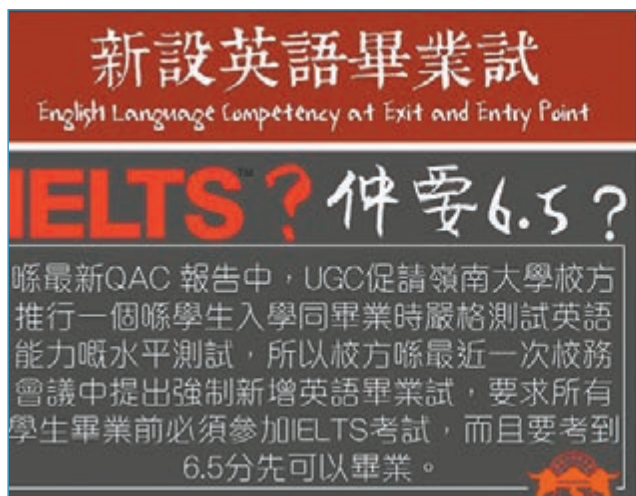
嶺大學生會在其facebook專頁提到，校方在最近校務會議中提出強制新增英語畢業試，學生會將於本週三舉行學術論壇討論事件。

發言人指，除了個別主修科目或可獲特別批准，採用較高（如英文、翻譯）或較低（如中文）的IELTS成績外，所有學生均需符合有關要求方能畢業，但並無規定學生應考IELTS的次數。