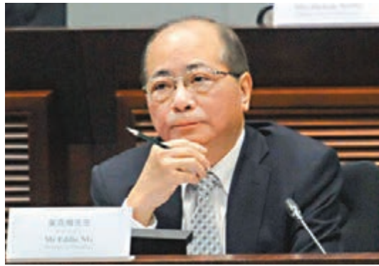
吳克儉稱完成本屆任期，是時候退休。資料圖片