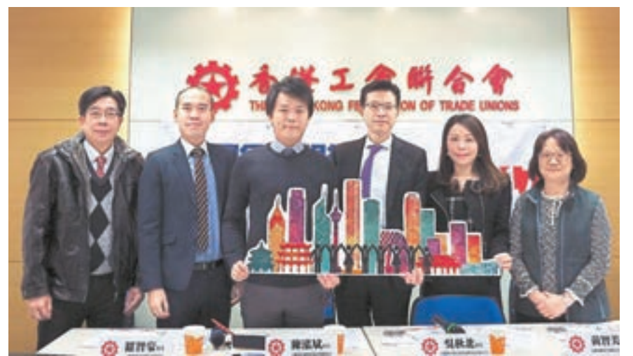
工聯會介紹「中國金融銀行業實習計劃2017」。