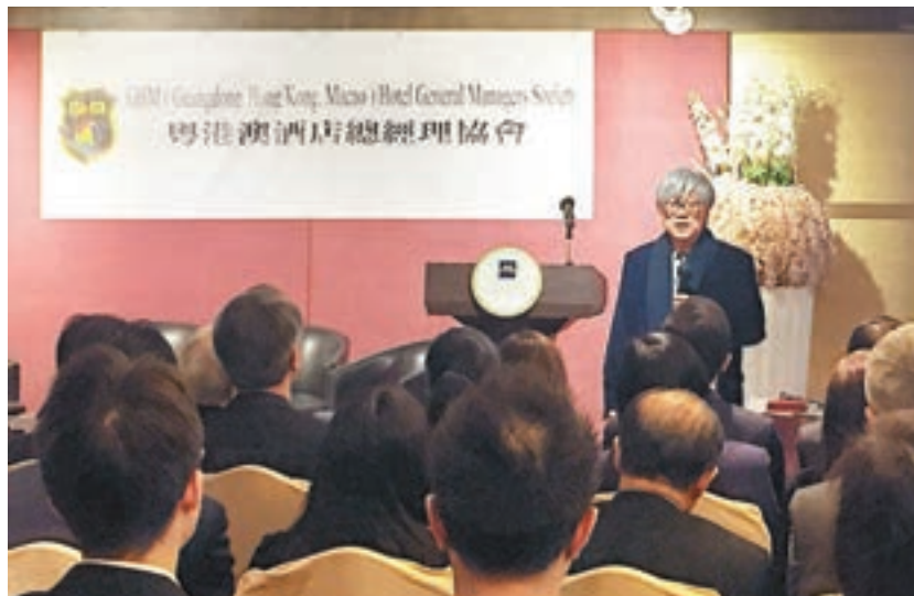
陳文鴻稱,香港普遍對「一帶一路」的議題有負面印象及抗拒心態,但做生意需要有能力及風險,直言「唔可以好似宅男咁收埋自己,建議業界到當地走走及多學習」,方能跟上時代步伐。

香港文匯報訊(記者 楊佩韻)旅遊業調整期進入新階段,加上「一帶一路」政策的漣漪效應,本港酒店業該如何應對?香港珠海學院「一帶一路」研究中心主任陳文鴻表示,大眾式消費旅遊增幅始終有限,反而文化旅遊持續有商機,更能隨着內地與俄羅斯、伊朗等地的經貿合作,吸引高增值商務旅客來港,建議業界做好準備。有中小企擔心走出去要冒太大風險,陳文鴻稱,香港普遍對「一帶一路」的議題有負面印象及抗拒心態,但做生意需要有能力及面對風險,直言「唔可以好似宅男咁收埋自己,建議業界到當地走走及多學習」,方能跟上時代步伐。