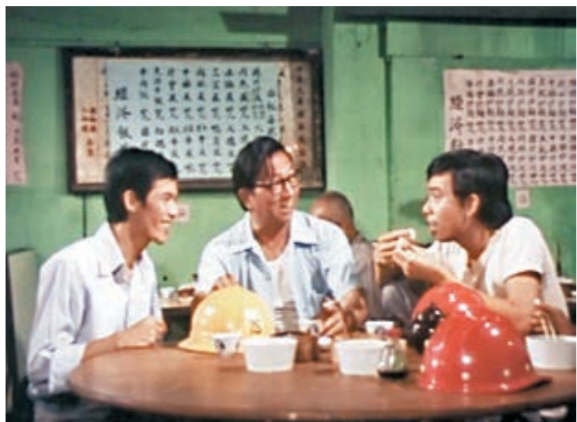
電影資料館「港人情繫獅子山」，回看當年香港人、物、情。資料圖片

於上世紀70年代，配合了獅子山下的小市民故事，這首歌極具鼓勵和振奮作用，獅子山更成了香港人奮鬥和逆境自強的象徵。歌曲透過電視、電台、唱片、網絡等媒體廣泛地在不同年代、不同脈絡中反覆傳播，跨越時空衍生出層層疊疊的意義。對於不同年齡及社會地位的香港人，歌曲的意義至今又會是什麼呢？