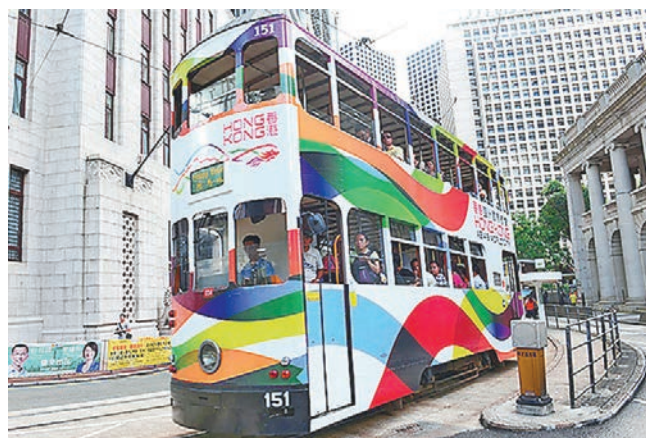
香港品牌形象標誌被應用在電車上。資料圖片

香港品牌形象標誌採用飛龍設計，結合七彩飄逸彩帶。象徵多元化和靈活應變力，藍色、紅色和綠色的彩帶分別代表藍天、獅子山下的拚搏精神和可持續發展的環境。