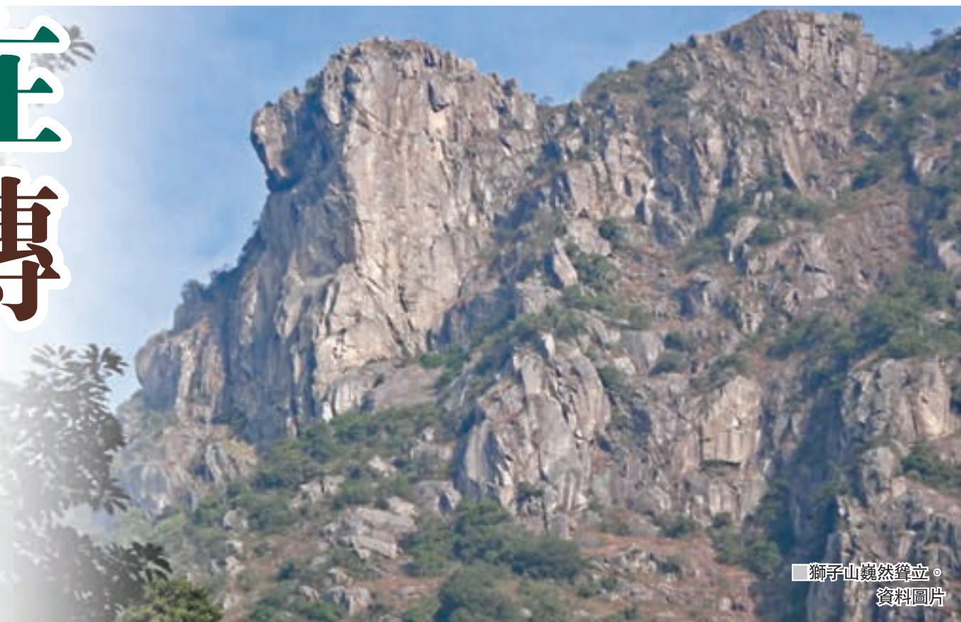
獅子山巍然聳立。