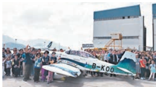
香港本土自行裝嵌小型飛機「香港起飛」尾翼髹上象徵香港的獅子山圖案。資料圖片

尾翼髹上象徵香港的獅子山圖案的香港本土自行裝嵌小型飛機「香港起飛」，已成功前往25個國家、50個機場，航程55,000公里，環繞地球1.4圈。從孤軍作戰買入第一組零件，到後來