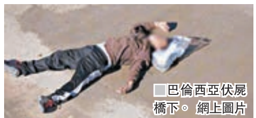
巴倫西亞伏屍橋下。

美國政府周二發出兩份備忘錄，計劃將經墨西哥入境美國的非法移民，不論國籍一律遣返當地。備忘錄發出當日，一名墨國男子疑因第