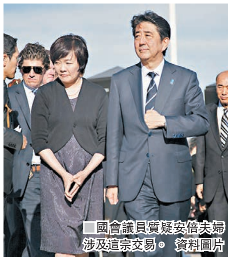
國會議員質疑安倍夫婦涉及這宗交易。資料圖片

日本首相安倍晉三的妻子安倍昭惠，原擔任日本私立學校集團「森友學園」屬下一間新建小學的榮譽校長，不過該集團日前被當地傳媒揭發，僅以市價的14%購入校址所在的一幅大阪府地皮，國會議員質疑安倍夫婦與該集團勾結，協助它低價買地，安倍否認有關說法。森友學園早前因屬下一間幼稚園派發歧視中國和韓國人的單張，遭大阪府問話。 該筆交易被當地傳媒揭發後，小學網站上有關安倍昭惠支持建校的訊息和圖片昨日隨即被移除。