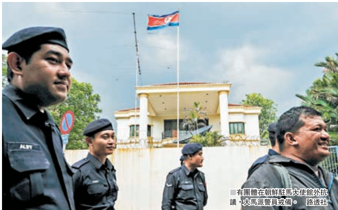
有團體在朝鮮駐馬大使館外抗議，大馬派警員戒備。