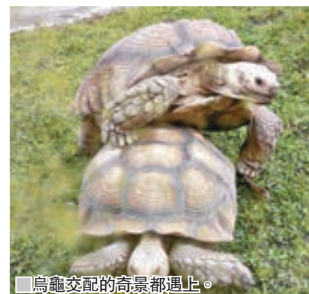
烏龜交配的奇景都遇上。

有關活動最新消息，請密切鎖定台灣觀光協會駐香港辦事處 Facebook專頁 | Itstimefortaiwanhk/