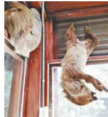
樹懶行和食東西都是倒吊。