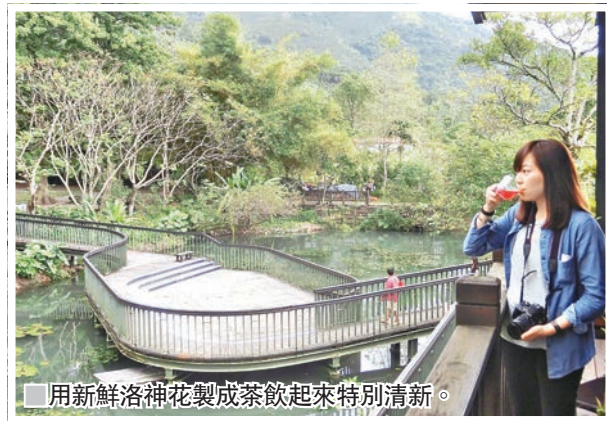
用新鮮洛神花製成茶飲起來特別清新。

新年假過了，復活節將到，短程假期正好給自己一個花蓮農場度假休閒的機會，到新光兆豐休閒農場，踩着腳踏車遊園看動物，亦可到欣綠農園體會採摘農作物，在自然創作室DIY，用植物的乾果或枝幹編製出各式各樣藝術擺設，並享用原住民野菜料理，實在是一家大細親子好節目。