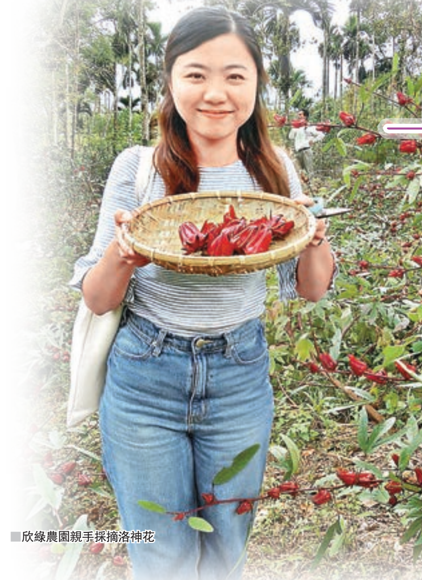
欣綠農園親手採摘洛神花