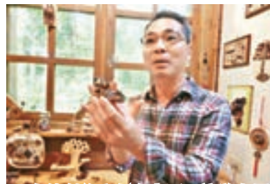
自然創作室很有意思，讓遊人用植物的乾果或枝幹編製出各式各樣藝術擺設。

弟弟經營農園以獨創的野菜及湧泉鹽烤魚料理，成了來花東縱谷遊客必嚐的地方特色。老闆主廚雖然不是原住民子弟，但煮的料理是當地阿美族人常吃的野菜大餐，還自行研發了許多原住民都不知道的吃法，農園的料理融合漢人與阿美族的飲食精華，加上各種時令的本地新鮮食材，獨特手藝烹飪出一道道創意料理，必點的有鹽烤鮮魚、牧草筍做出來的「長命百歲」、野菜山豬肉、養生豬腳。不可錯過招牌菜石頭火鍋，老闆解釋先烤到紅透透的石