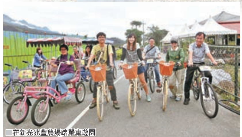
在新光兆豐農場踏單車遊園