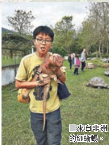
來自非洲的紅蜥蜴。