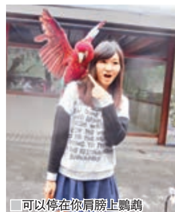
可以停在你肩膀上鸚鵡