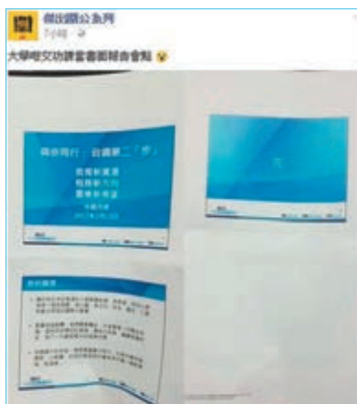
「傑出關公」「剪貼」屈林鄭簡報太懶，因被人發現頁碼有誤而「破功」。