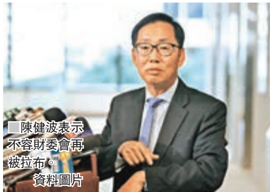
陳健波表示不容財委會再被拉布。

立法會工務小組委員會昨晨繼續處理由反對派議員提出的臨時議案。盧偉國提醒，有關項目已在工務小組討論了15小時，希望議員盡快表決。不過，反對派未有理會。其中，九龍西議員劉麗首先提出多項臨時動議，分別要求撤回運塘口岸的工程撥款，及將廣深港高鐵的項目分開處理等，但動議全部被否決。