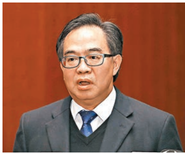
盧偉國應對反對派濫提臨時動議「炸會」，果斷剪布。資料圖片

香港文匯報訊(記者 鄭治祖)立法會工務小組委員會昨晨舉行第五次會議，繼續審議涉及逾124億港元的基本工程儲備基金的撥款。反對派議員繼續拉布，更提出逾百項臨時動議。主席盧偉國提前「剪布」，多名反對派議員湧到主席台，但基本工程儲備基金的撥款最終在18票贊成、1票反對的情況下，大比數獲得通過，交財務委員會審批。由於撥款申請還須經財委會審議，反對派議員稱會在財委會繼續玩嘢。財委會主席陳健波強調，他不會容許有關項目「從頭再討論一次」，「有可能傾15個鐘」，意味或會剪布。