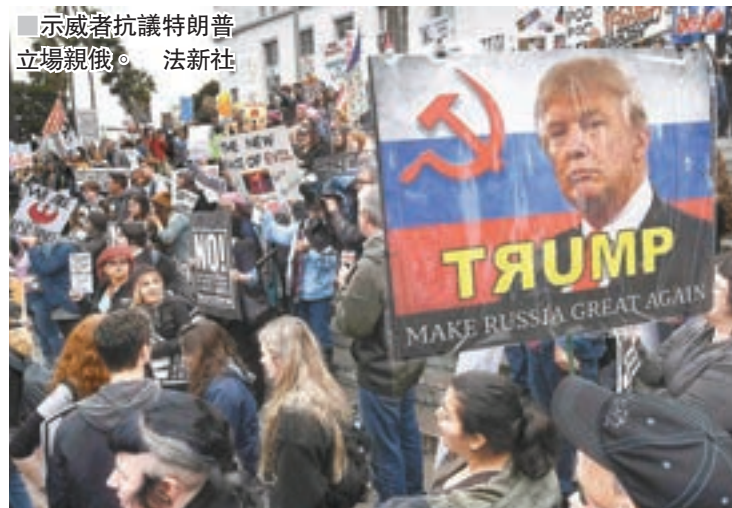
示威者抗議特朗普立場親俄。