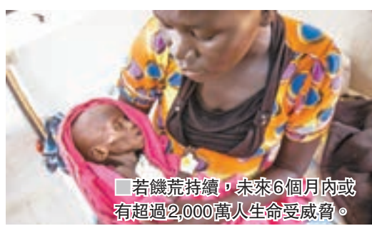
若饑荒持續，未來6個月內或有超過2,000萬名生命受威脅。