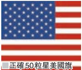
正確 50 粒星美國旗

在推特指出錯誤，網民隨即笑稱，多出來的一顆星是代表華盛頓所在的哥倫比亞特區、海外屬地波多黎各，或是去年決定脫歐的英國。歐盟回應指，今次事件因一名技術員犯錯所致，強調背後並無任何隱藏含意。