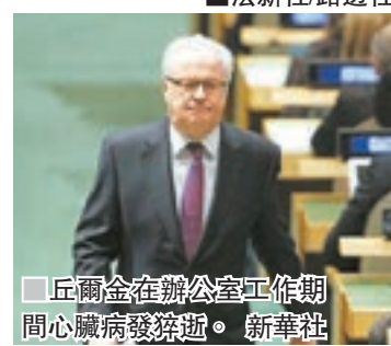
丘爾金在辦公室工作期間心臟病發猝逝。