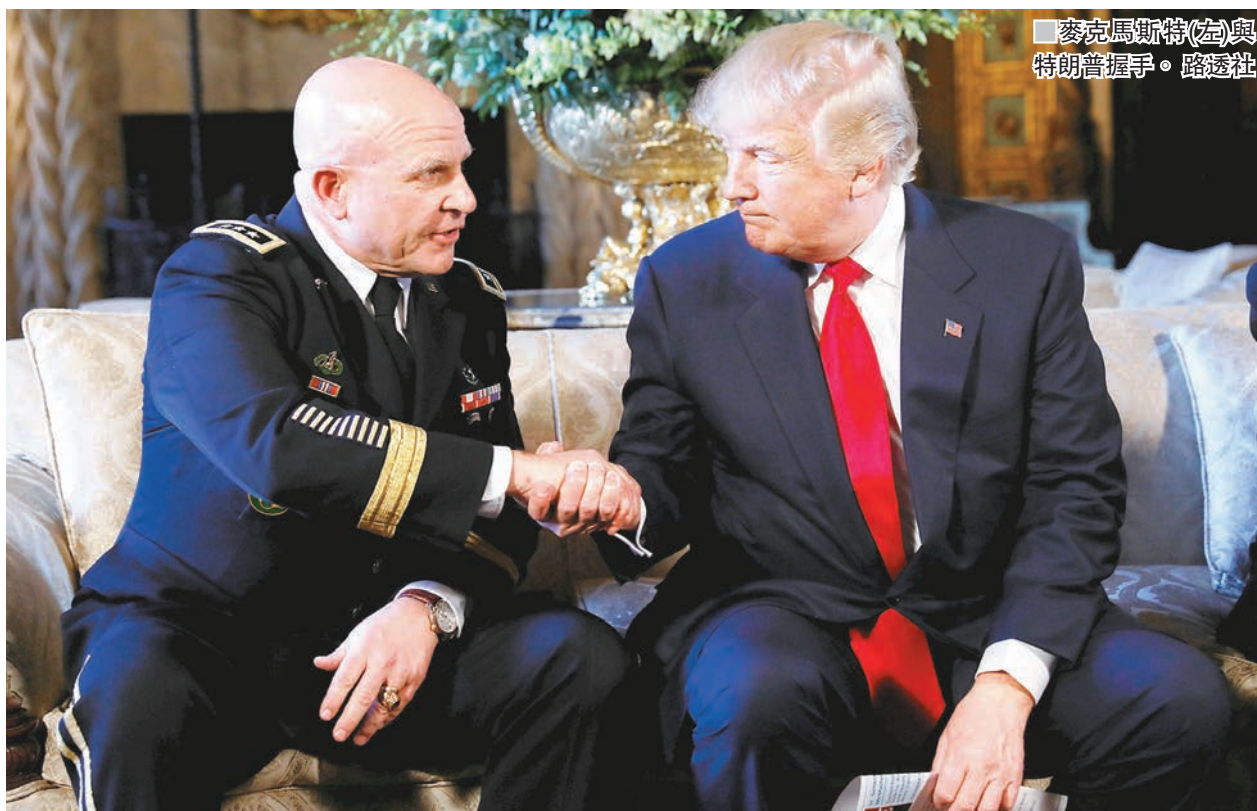
麥克馬斯特(左)與特朗普握手。

美國總統特朗普前日任命現役陸軍中將麥克馬斯特，出任國家安全顧問，取代因「私通」俄羅斯而辭職的弗林。54 歲的麥克馬斯特可謂文武雙全，擁有歷史博士學歷，亦曾參與海灣戰爭，作戰經驗豐富。他以敢言及「反傳統」見稱，曾批評美國政府領導無方以致輸掉越南戰爭。分析指，特朗普延續招攬軍人入閣的作風，但麥克馬斯特對俄國立場強硬，或會挑戰特朗普的權威。