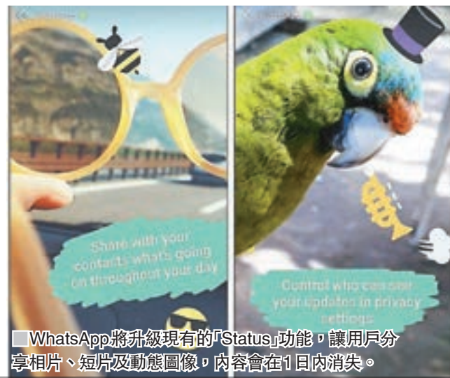
WhatsApp 將升級現有的「Status」功能，讓用戶分享相片、短片及動態圖像，內容會在1日內消失。