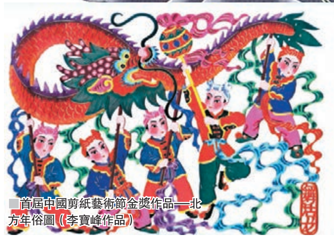
■首屆中國剪紙藝術節金獎作品——北方年俗圖(李寶峰作品)