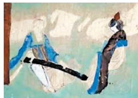
■敦煌中講述愛情的壁畫。

西佛東漸的過程中，佛教藝術也和中國傳統藝術相融合，在表現相關愛情主題的雕刻或壁畫中，西方顯得直白熱烈，中國則更加含蓄內斂。這正好從藝術表現上反映出中西方對愛情不同的表達方式。