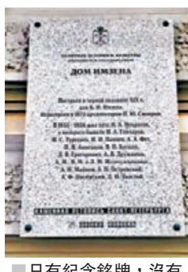
■只有紀念銘牌，沒有故居