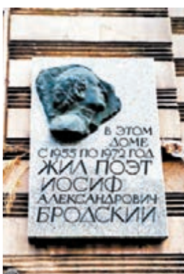
■布羅茨基紀念銘牌