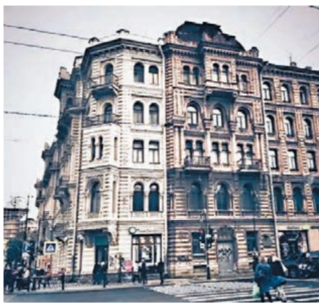
■彼得堡鑄造廠大街24號，布羅茨基那一個半房間的地址

迢迢跑到彼得堡，天天蹲守普希金，又寫了著名的《彼得堡故事》在彼得堡肯定應該有故居。網上查了住處，離普希金喝人生最後一杯咖啡的地方不遠，奔過去一看：瑞典領事館。連掛牌待遇都沒有？後來去涅克拉索夫故居，跟着看守故居的大媽閒聊，問及此事，大媽一撇嘴：「確實沒有果戈里故居。因為他不喜歡彼得堡。作品裡凡是涉及到彼得堡的，沒一件好事。後來還跑到國外去了，還死在國外了，國家就沒給他整故居。」