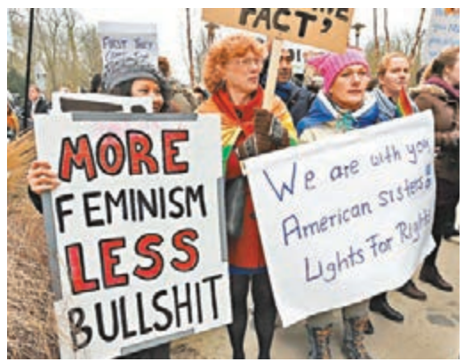
有美國人抗議特朗普歧視女性，舉牌叫特朗普少說廢話。

美國總統特朗普言論出位，已屢次惹起外交風波，他上周六在一個集會就收緊移民政策發言，提到曾經發生恐怖襲擊的地點時，聲稱「看看瑞典昨晚(上周五)發生什麼事」，暗示當地遇襲，但媒體查證後證實並無此事，結果淪為國際笑柄，網民紛紛挖苦特朗普，瑞典政府更要求美方澄清。特朗普前日在twitter解釋，是看到霍士電視台的報道才出此言，被質疑誤將探討瑞典移民問題的節目當作新聞。