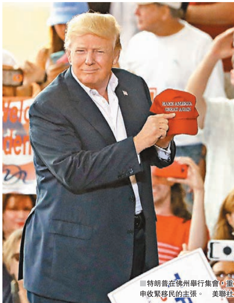
特朗普在佛州舉行集會，重申收緊移民的主張。美聯社