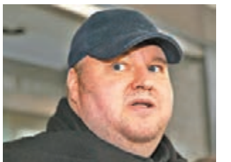
金德康前年離開法庭。

總部設於香港的知名檔案分享網站 Megaupload，公司創辦人金德康2012年被控侵權，於新西蘭落網，當地法院裁定他可被引渡至美國受審。金德康去年上訴尋求推翻裁決，新西蘭高等法院昨日駁回。金德康代表律師曼斯費爾特揚言會繼續上訴。