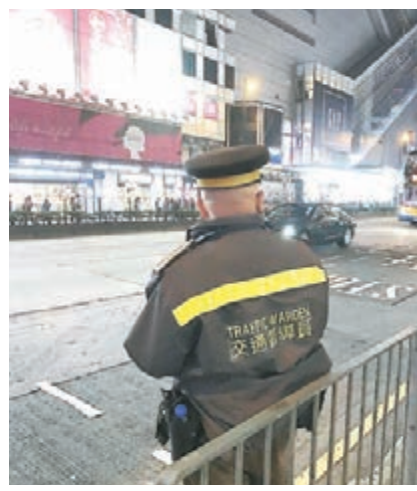
交通督導員在巴士站疏導。