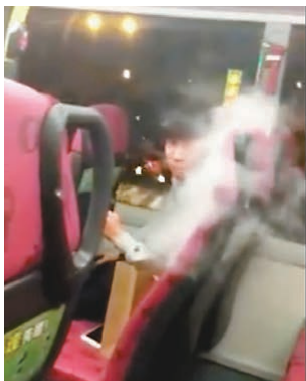
短片中一名年輕男子於巴士後座吸煙,轉個頭向拍片的乘客吐出大量白色煙霧。

街談網議 年輕人愛模仿,有人認為吸煙有型又威水,卻不知惹上煙癮最終受害的是自己。日前有網民「MK的傳說」於facebook專頁上載短片,片中一名年輕男子於巴士後座吸煙,轉個頭面向拍片的乘客吐出大量白色煙霧,不以為然,拍攝者的竊笑聲亦錄入片中。短片上載不足一日便有5萬次瀏覽,有網民指片中男子吸食電子煙,希望政府加強對電子煙的監管。亦有網民批評短片「影衰囉(晒)食電子煙嘅人!」 短片僅長8秒,拍到一名約10幾歲的男子於巴士後座吞雲吐霧的情景,片中巴士正在行駛中,司機或未發現車上有人吸煙。香港吸煙率逐年下降,與市民對吸煙危害的認識加深有關。寫給年輕人的歌詞亦告誡「千祈唔好食煙,點解,因為你想像唔到佢有幾難戒。」、「廿年煙癮唔肯戒的肺泡就快冇晒。」 不過,不吸食傳統香煙,吸食電