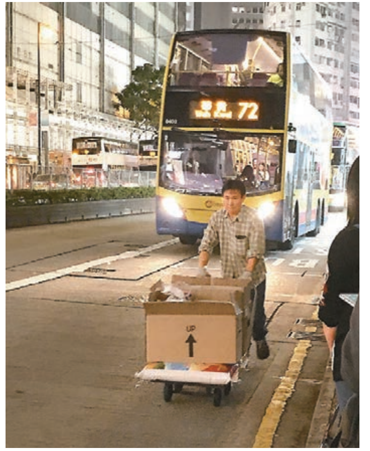
昨日傍晚銅鑼灣一帶交通大致良好。

由於巴士車長參與「依法上落客」的行動前晚已在網上瘋傳,不少市民昨晨上班或上學均提早出門,以免因巴士在埋到站時才讓乘客上落車的行動,會令巴士站出現排隊人龍,導致行程受阻。 昨日本港路面的交通情況大致暢順,不論早上或下午,在發生巴士車長被檢控事件的中環怡和大厦外巴士站,抵站巴士均可完全停泊在劃定的巴士站區內上落客,前方若有巴士上落客,部分尾隨巴士會等候前方巴士駛離後才埋站,惟巴士站範圍仍偶然的士司機在該處上落客。