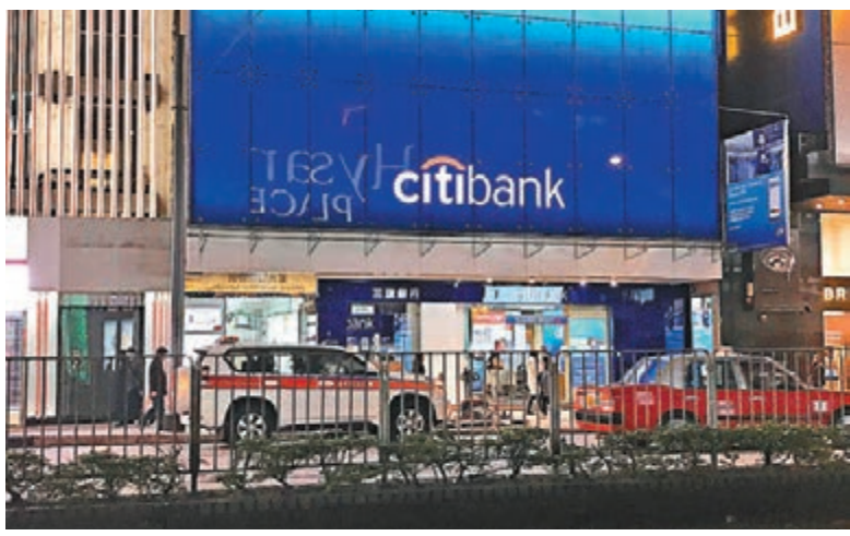
昨日傍晚銅鑼灣一帶不時有警車停靠,阻嚇違泊司機。

香港文匯報訊(記者 文森)因有巴士車長未在巴士站指定範圍上落客而遭警方檢控,有巴士工會昨日發起「依法上落客」行動,呼籲巴士車長「駛正站頭」才打開車門讓乘客上落車。昨天全日在港島區多個巴士站,車長多按規定在巴士站範圍內上落客,警方亦派員在部分巴士站巡查並檢控阻塞巴士站的車輛,各區交通情況大致暢順。