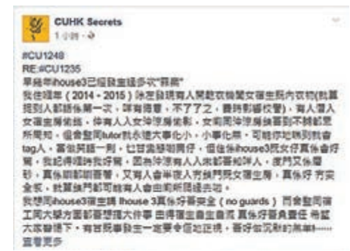
「CUHK Secrets」fb專頁上,有女宿舍生聲稱被偷窺。