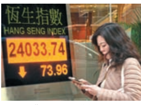
■ 港股二萬四關昨失而復得，成交868億中通社