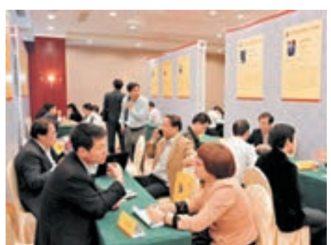
■福建(福州)海外人才與項目對接洽談暨創業項目投融資對接會現場。本報福建傳真

香港文匯報訊(記者 蘇榕蓉 福州報導)福建省福州市創新發展大會日前在海峽國際會展中心舉行。會上,福州市發佈推動新一輪經濟創新發展十項政策,包括49條舉措。