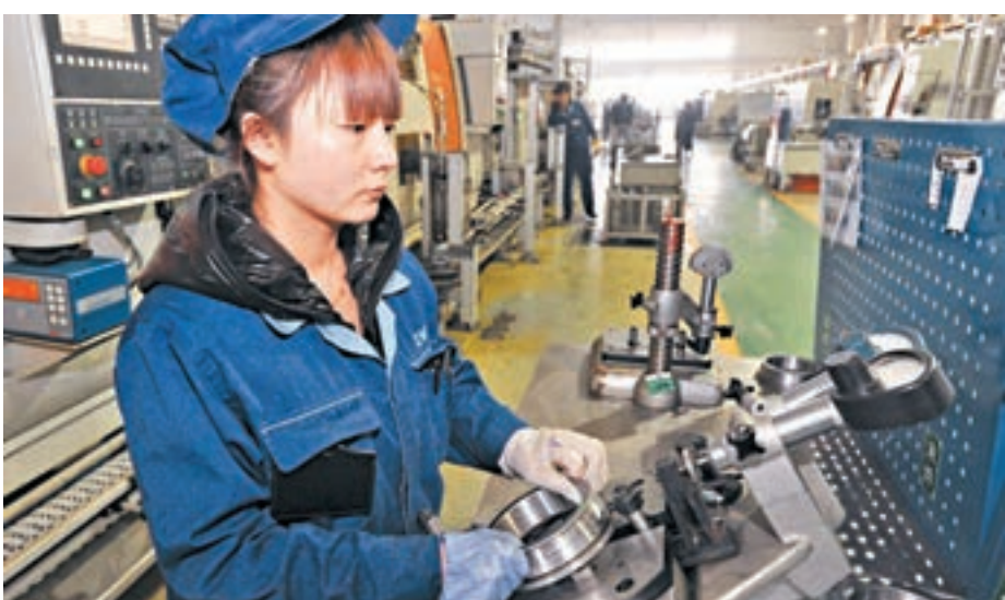
■遼寧今年將首次探索混合所有制企業員工持股,年內將進10家企業試點。圖為一名工人在遼寧大連瓦軸集團檢測軸承套圈。

企業員工持股,據劉立國透露將在年內推進10家企業成為改革試點。同時,省國資委還將以建立現代企業制度和做強做優做大國有企業為着眼點,通過股權多元化改革,引進戰略投資者,推進上市特別是整體上市或核心業務資產上市、併購重組、