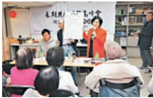
葉太出席安老服務座談會。

「真普選醫生聯盟」未等「協調」就宣佈「新方案」，明顯當「300+」有到，但「300+」召集人之一、公民黨立法會議員郭榮耀昨日就死雞難飯蓋稱，黃任匡前已「通知」他舉行記者會的決定，更形容對方此舉正好回應了「300+」的呼籲，即盡早確定提名意向，讓反對派落實提名策略云云。