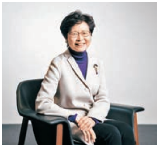
林鄭月娥近日接受彭博通訊社訪問。

香港文匯報訊(記者 鄭治祖)香港特首應有所擔當，着力為港人創造一個更好的生活環境。特首參選人、前政務司司長林鄭月娥在接受傳媒訪問時表示，未來特首應只有一個目標，就是做好特區政府的管治工作。倘她有幸成為特首，首要任務是刺激經濟增長，維持香港作為國際金融中心的地位。