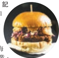
「慢煮豬肩肉三文治」。

香港文匯報訊(記者 楊佩韻)再有1架美食車 Beef and Liberty 獲取食物製造牌照,將於下周一(2月20日)在海園公園外位置營業,主打菜式為「慢煮豬肩肉三文治」(見圖),令美食車總數增至12架。旅遊事務署發言人稱,餘下4架美食車的籌備工作進展順利,預計於2月尾至3月陸續營運。旅遊事務署昨日為12架美食車進行抽籤,決定新一輪營運場地輪替表,如主打美式包的「大師兄美食車」將由灣仔金紫荊廣場轉至尖沙咀梳士巴利花園,營運期為3月6日至3月19日。詳情可到旅遊事務署網頁或手機應用程式「HK FOOD TRUCK」查閱。