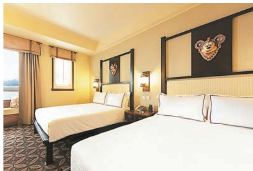
每間客房都設有2張加大雙人床。