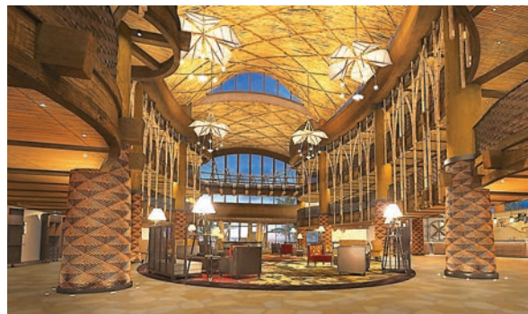
酒店大堂的夢想之泉。