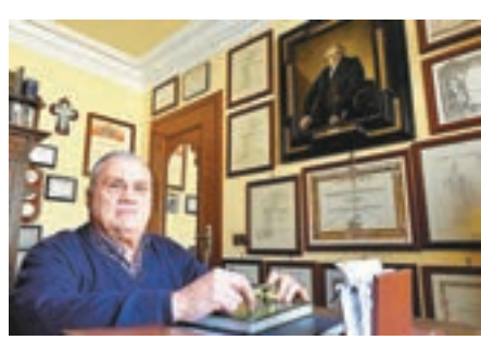
巴耶蒂房間掛滿證書。