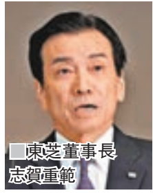
東芝董事長志賀重範

《日本經濟新聞》昨日報道，電子生產商東芝因美國核電業務大幅虧損60億美元(約465.6億港元)，將向投資者發出警告，表示難以持續營運。東芝更押後原定昨日公佈去年4月至12月份業績報告，觸發投資者恐慌拋售，東芝股價一度急挫9.45%，收市報229.8日圓(約15.7港元)，仍跌8%。