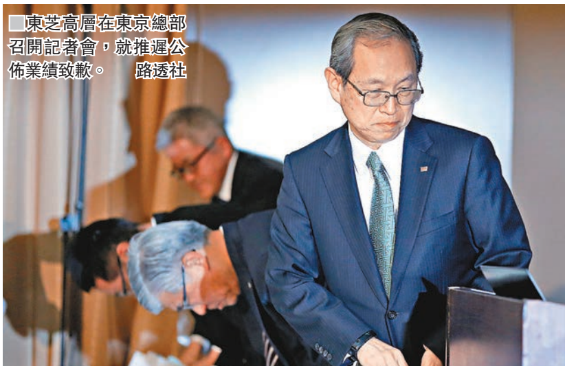
東芝高層在東京總部召開記者會，就推遲公佈業績致歉。