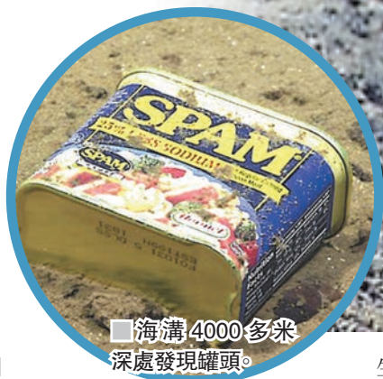
海溝4000多米深處發現罐頭。

科學家前日在《自然-生態學與進化》期刊發表研究報告，指出在深達10公里的太平洋馬里亞納海溝捕捉的生物，體內含有高濃度的工業污染物，相信是沉入海底的塑膠垃圾和動物屍體積聚所致，嚴重破壞海洋生態。科學家原先以為海洋深處可免受人類污染，對今次發現感到驚訝。